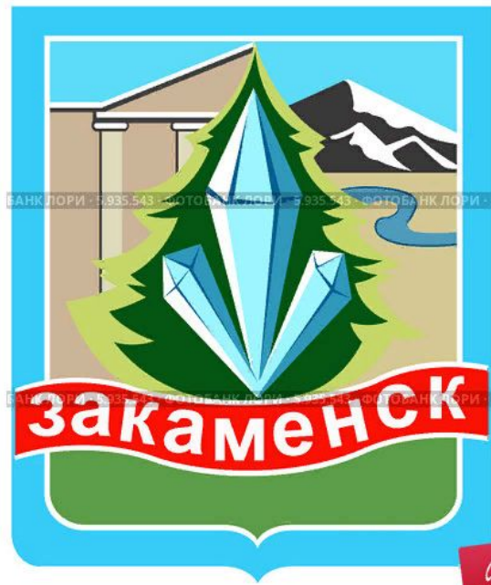
Герб города Закаменска. Бурятия

численность населения г. Закаменск- 11.249 человек