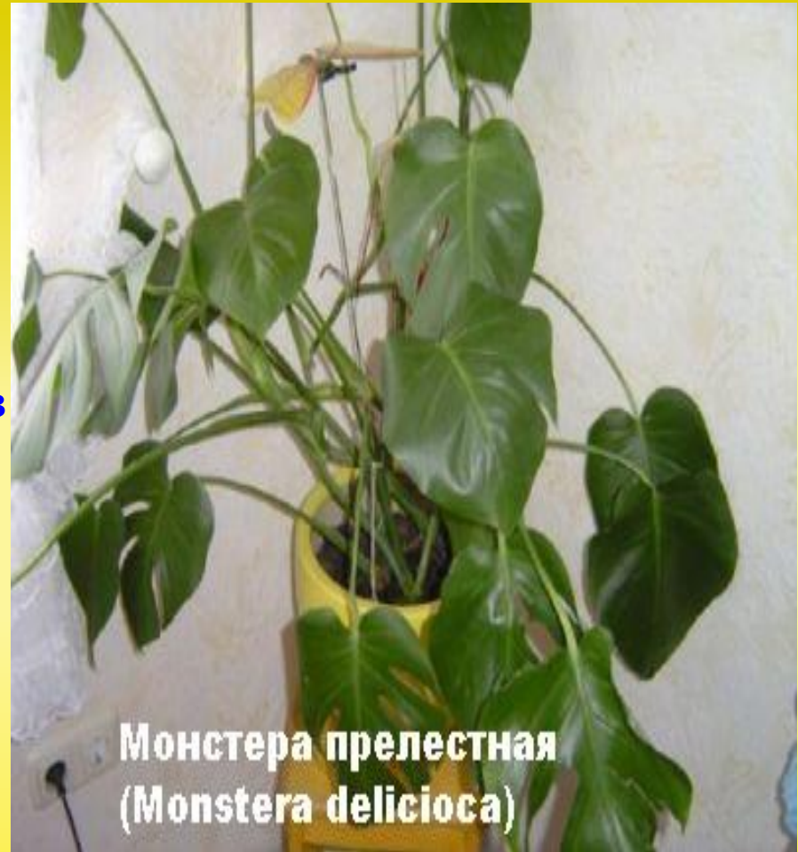
Монстера прелестная ( Monstera deliciosa )

Например, Монстера . Она буквально выкачивает энергию из человека. Поэтому держать монстеру в жилых помещениях опасно.