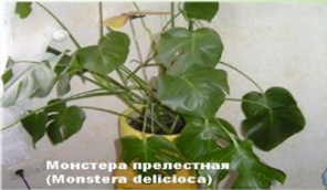
Монстера прелестная (Monstera deliciosa)

Растения лианы тоже забирают энергию у людей, усиливают тоску и одиночество