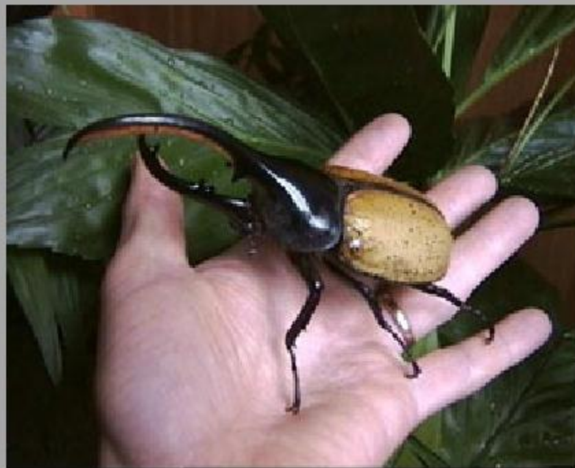
Жук - геркулес