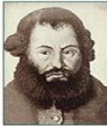
Создатели первого паровоза: отец и сын Черепановы