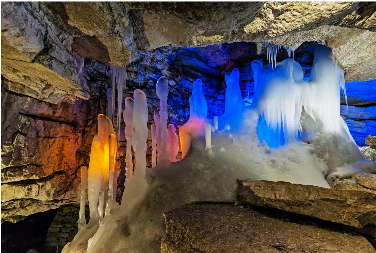
Кунгурская ледяная пещера