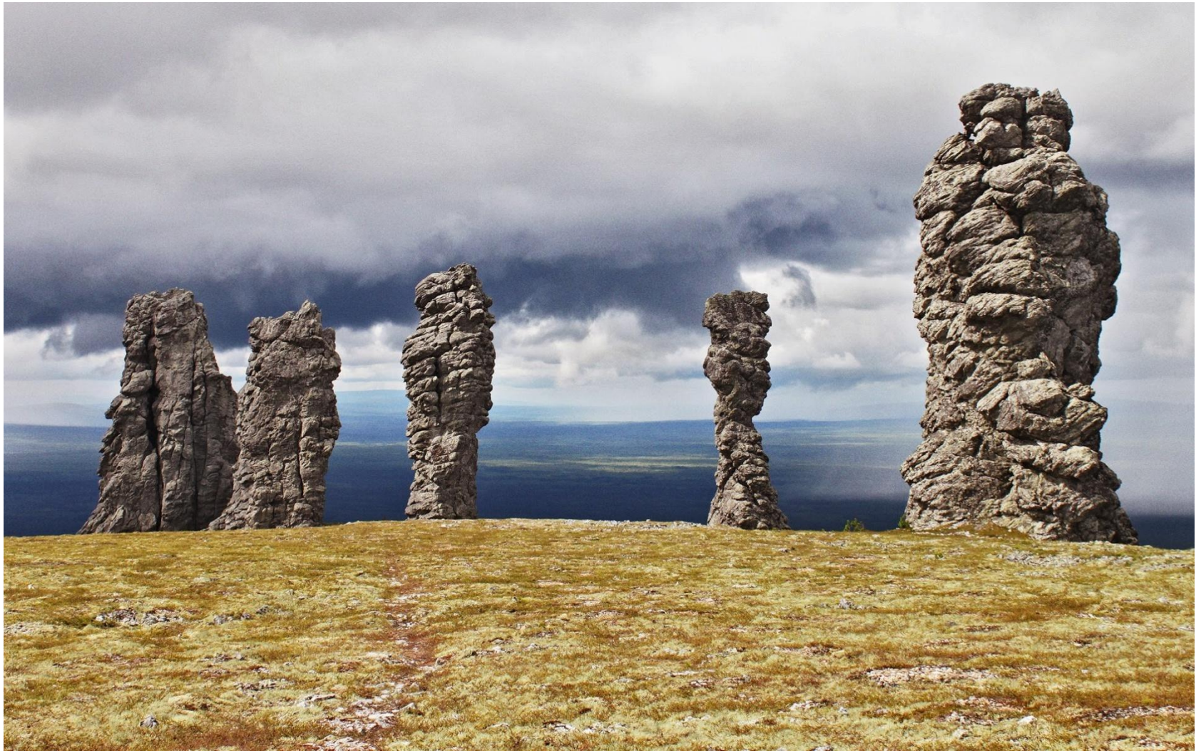
Столбы выветривания на Плато Маньпупунёр