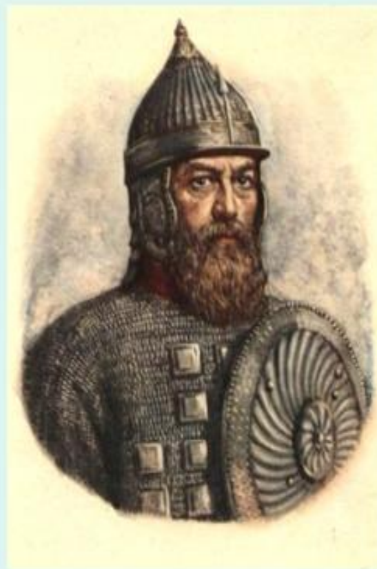
Князь Дмитрий Пожарский