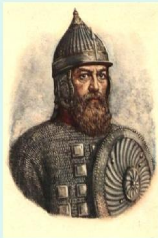
Князь Дмитрий Пожарский