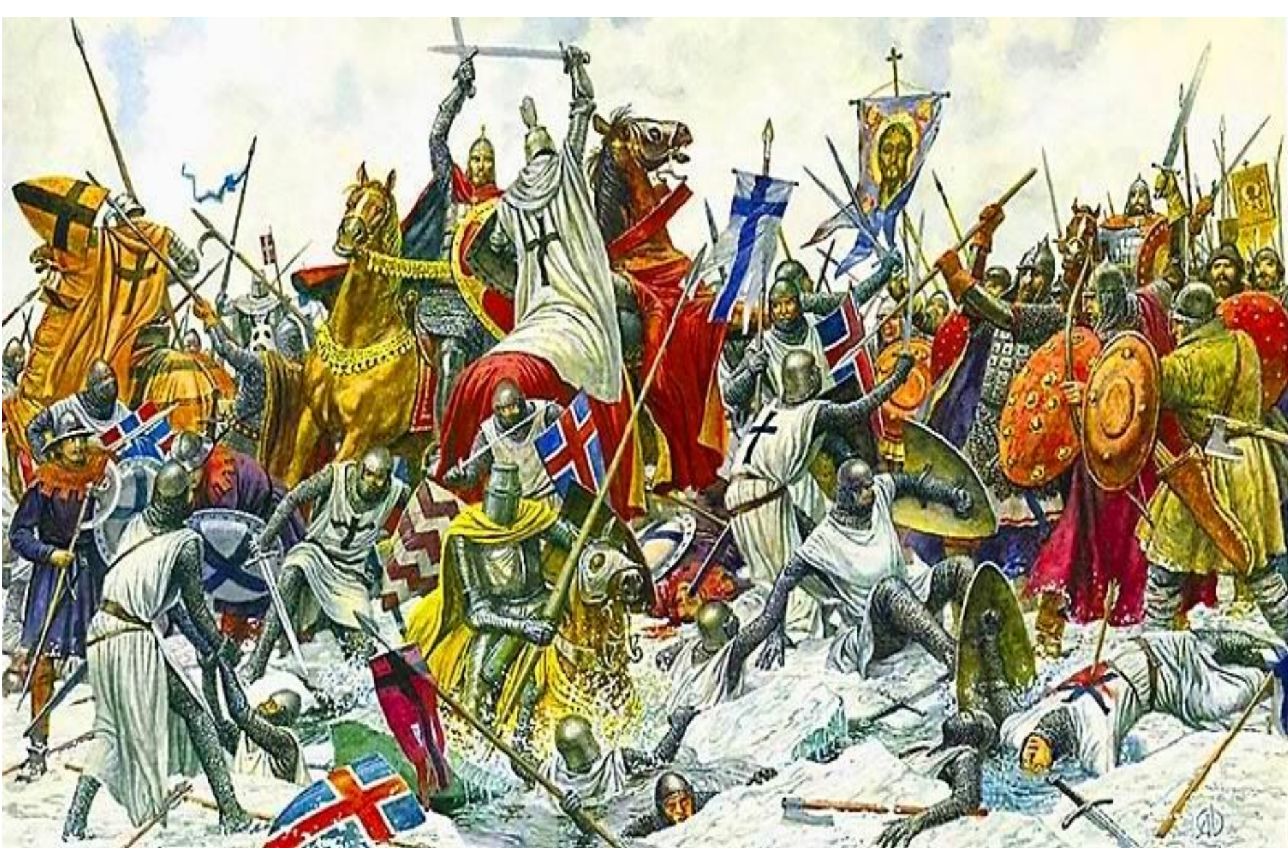
Битва на Чудском озере