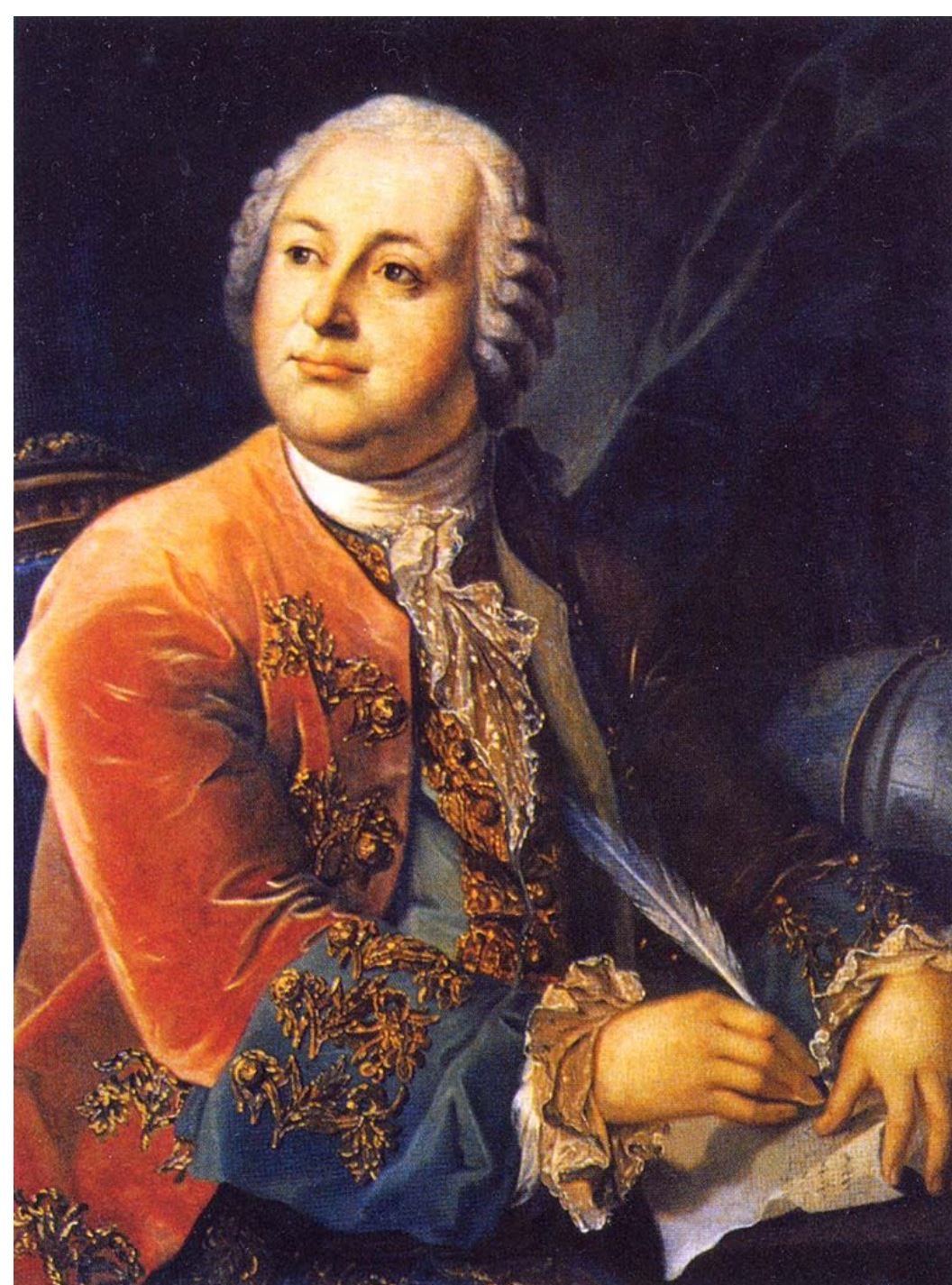
Михаил Васильевич Ломоносов