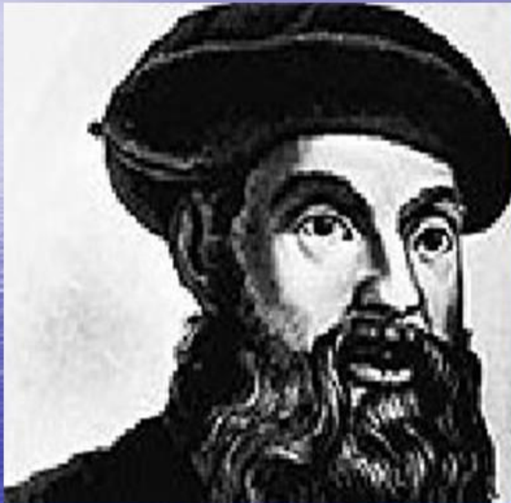
Фернан Магеллан. 1519 год