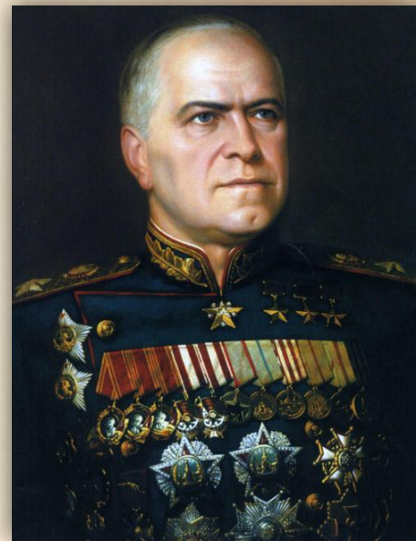
Георгий Константинович Жуков