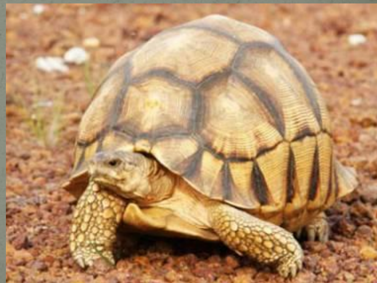
мадагаскарская клювогрудная черепаха