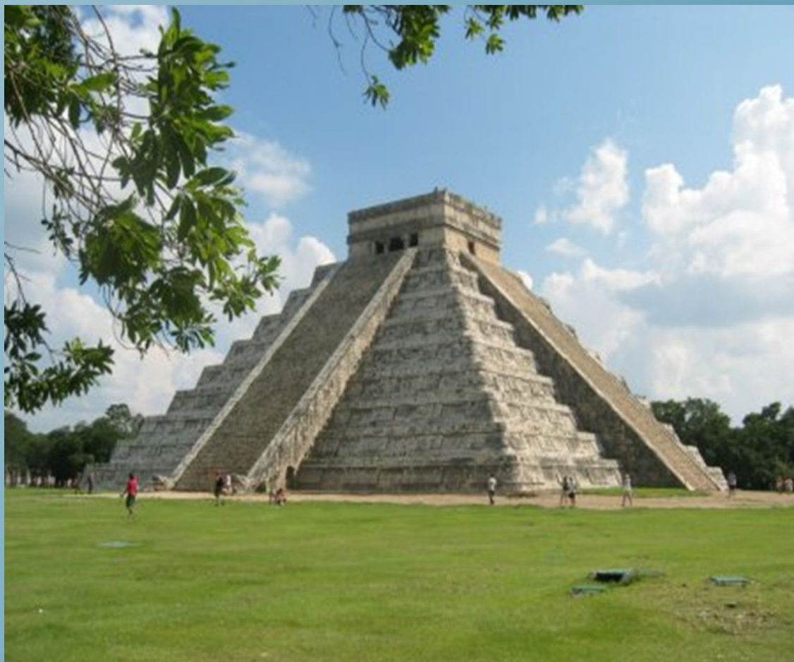
Чичен - Ица