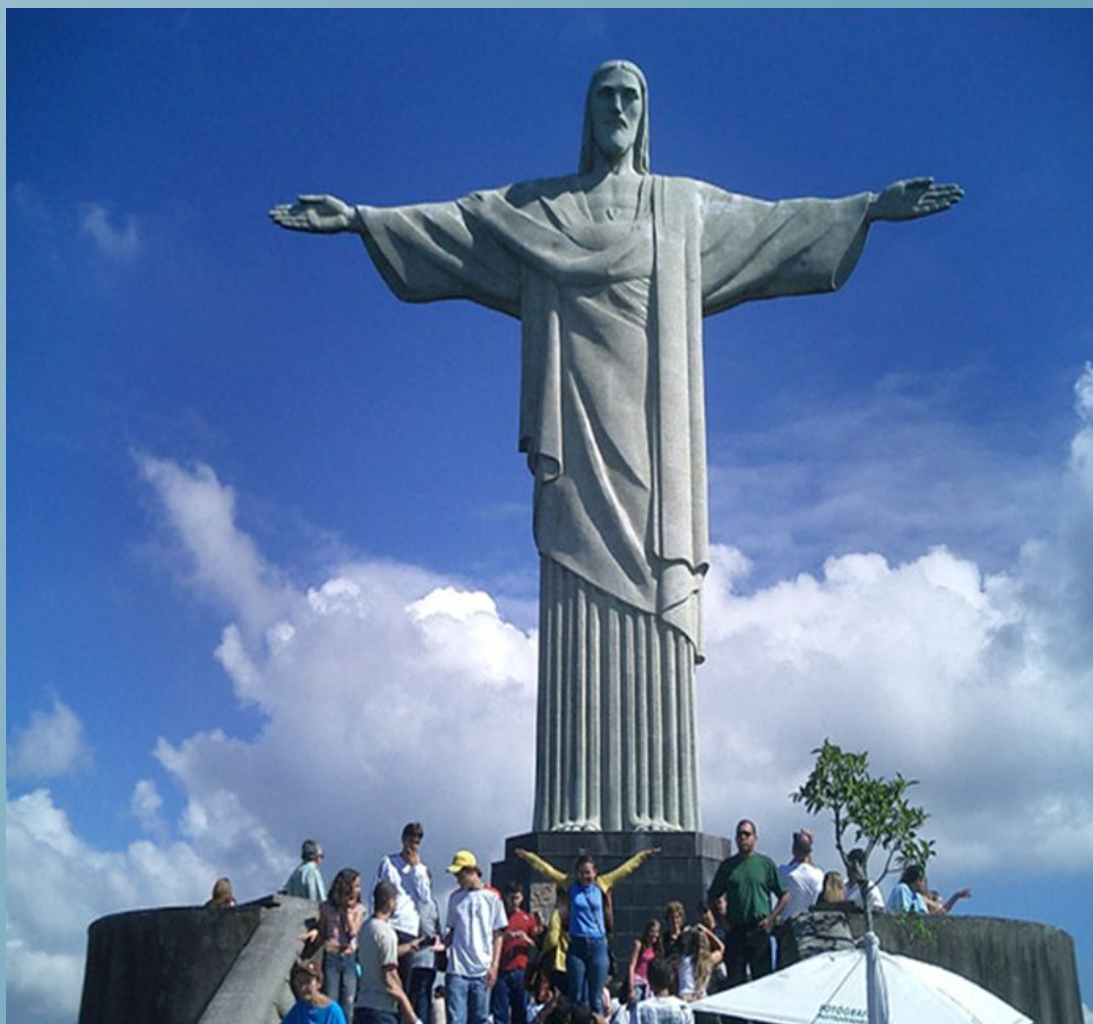
СТАТУЯ ХРИСТА ИСКУПИТЕЛЯ (СПАСИТЕЛЯ)