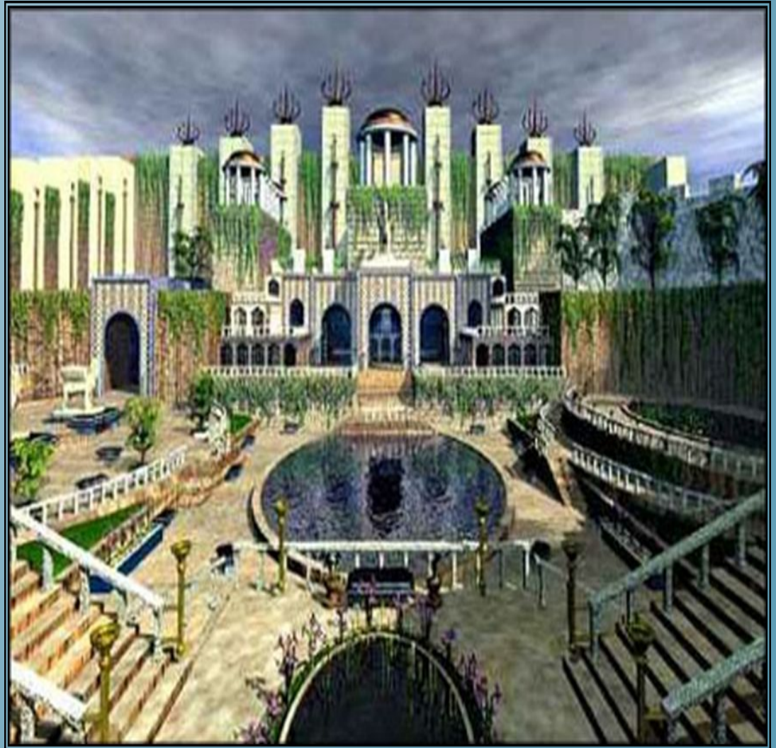
Висячие сады Семирамиды