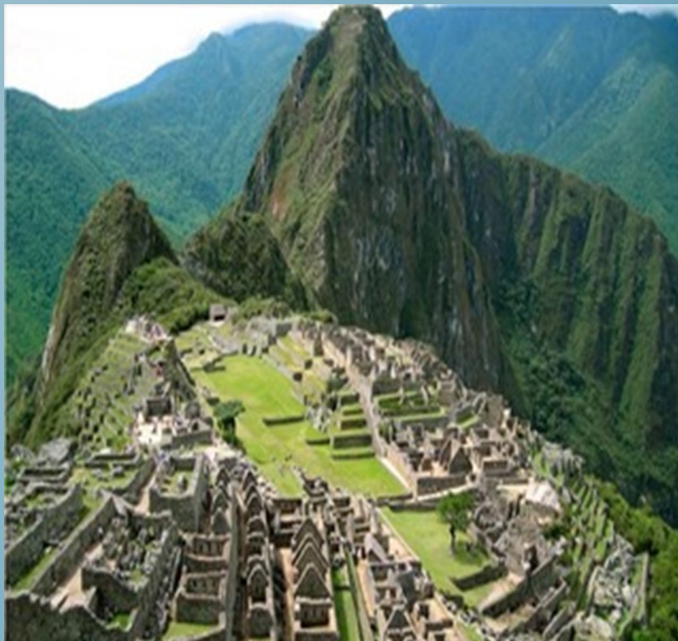
Город Мачу – Пикчу (город среди облаков)