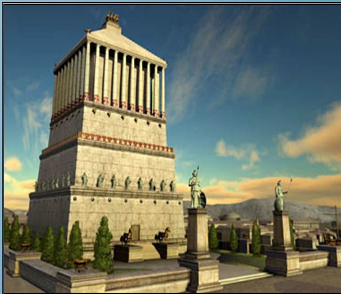
МАВЗОЛЕЙ В ГАЛИКАРНАСЕ