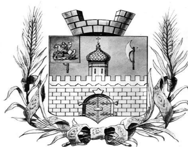
ГЕРБЪ СЕРГІЕВСКАГО ПОСАДА