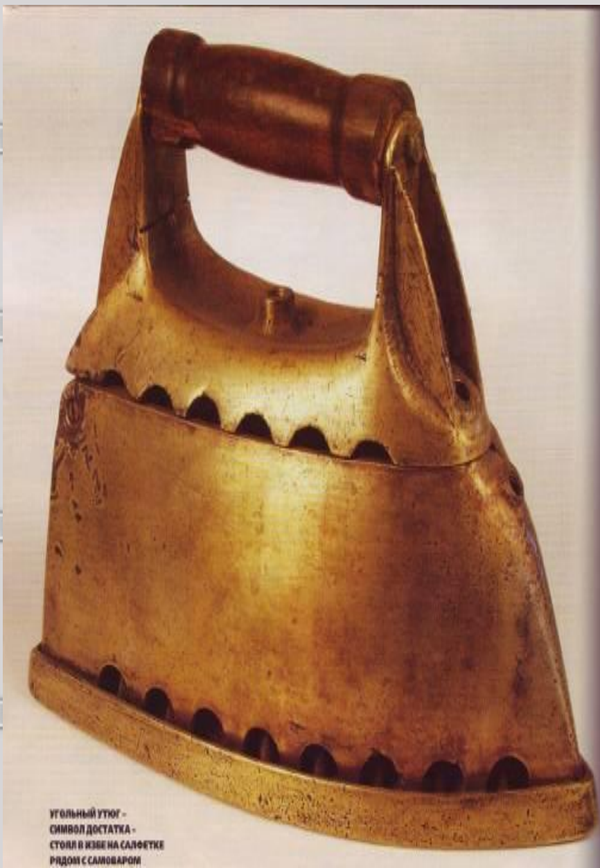
УГОЛЬНЫЙ УТЮГ - СИМВОЛ ДОСТАТКА - СТОЛ И КИЗЕ НА САЛФЕТКЕ РИДОМ С САЛОВАРОМ

-Утюг- тяжелый нагревающийся металлический прибор для глажения одежды и тканей.