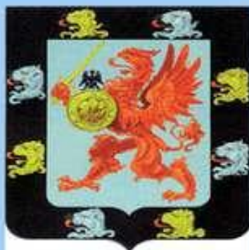
Герб рода Романовых.