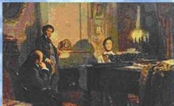
А.С. Пушкин и В.А. Жуковский у М.И. Глинки Художник В. Артамонов

В отличие от гербов и флагов, которые были символами государств ещё в глубокой древности, гимны, как государственные символы. Появились сравнительно недавно.