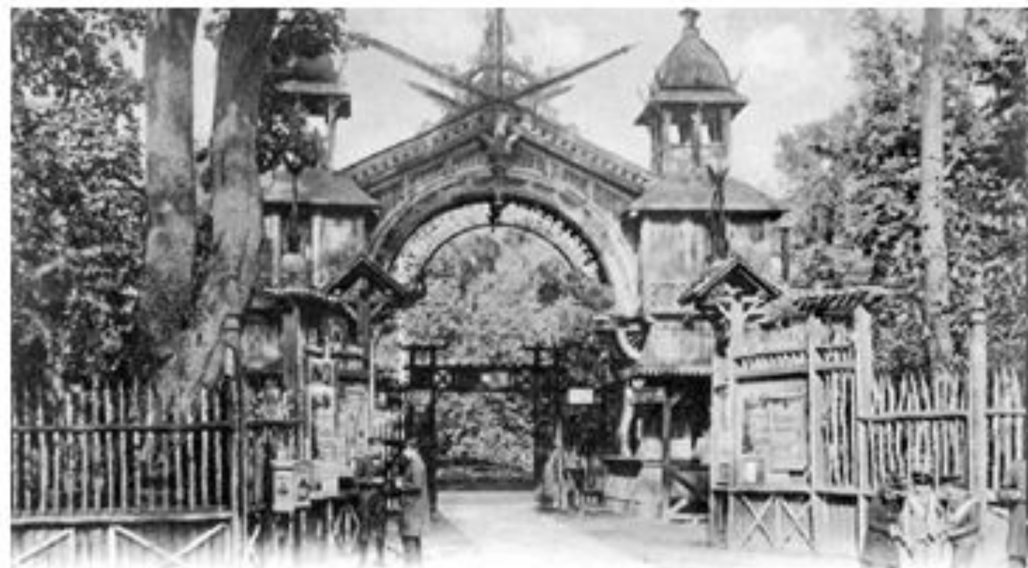
KÖNIGSBERG i. Pr.

Калининградский зоопарк - один из самых больших и старых зоопарков России. Зоопарк в Калининграде был открыт в 1896 году.