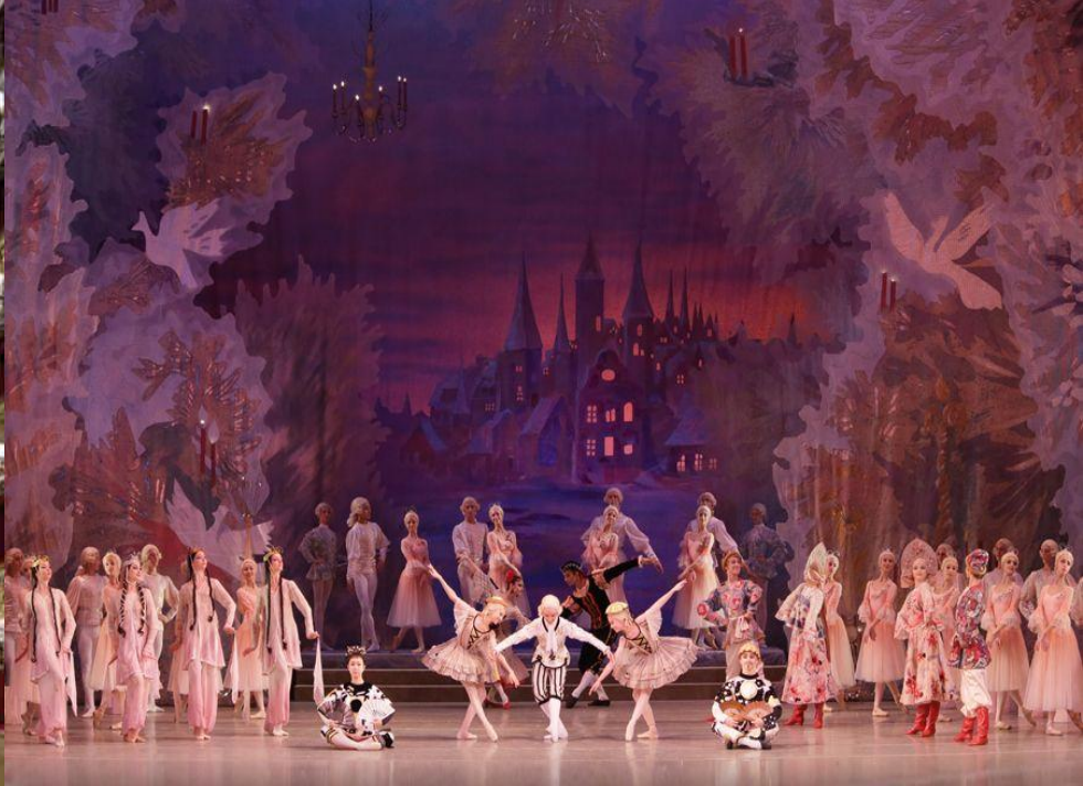
Государственный академический Мариинский театр (в 1935—1992 гг.) один из ведущих музыкальных театров России и мира.