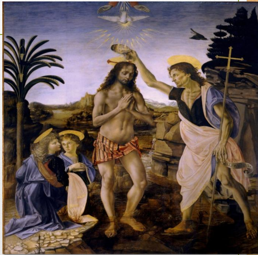
Андреа Верроккьо и Леонардо Да Винчи «Крещение Христа»