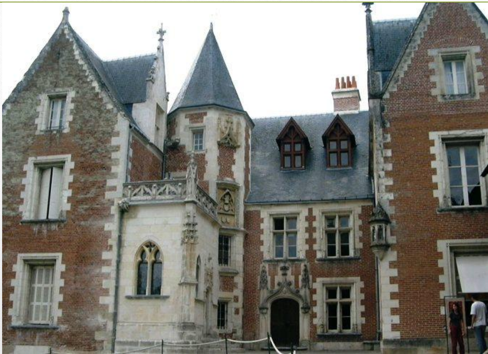
Кло-Люсе, место смерти Леонардо