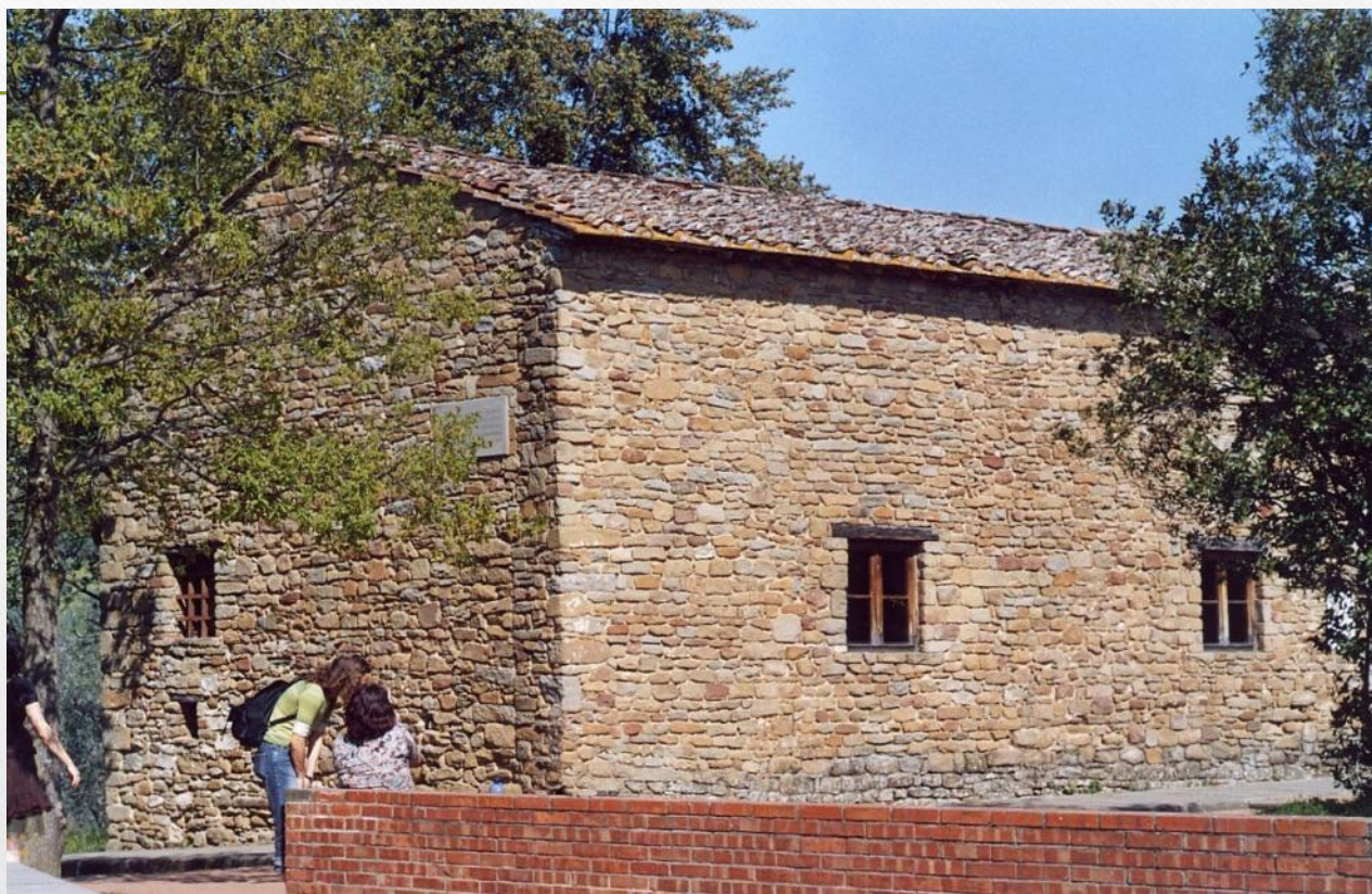
Дом, в котором родился Леонардо

Леонардо Да Винчи родился в селении Анкиано близ Винчи, недалеко от Флоренции. Он был внебрачным сыном зажиточного нотариуса и простой крестьянки.