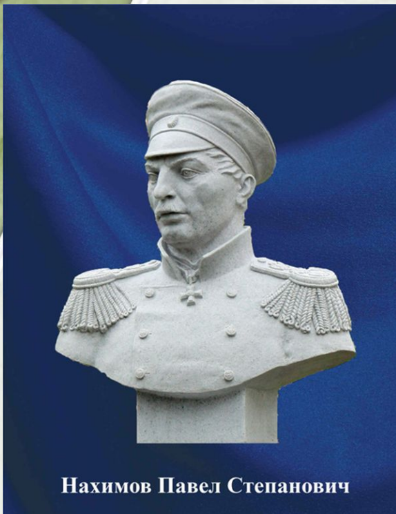
Нахимов Павел Степанович

П. С. Нахимов обладал большими военными дарованиями; отличался смелостью и неординарностью тактических решений, личным мужеством и хладнокровием. В бою стремился максимально избежать потерь. Огромное значение придавал боевой выучке матросов и офицеров.