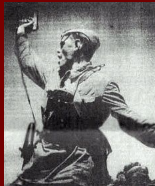
«За Родину!» Командир Красной Армии поднимает бойцов в атаку.

осенью был сорван. Армии под Москвой в декабре 1941 года немцы были отброшены. Ленинград, находящийся в блокаде, мужественно держался — несмотря на то, что самой страшной блокадной зимой 1941–42 гг. от голода и холода погибли сотни