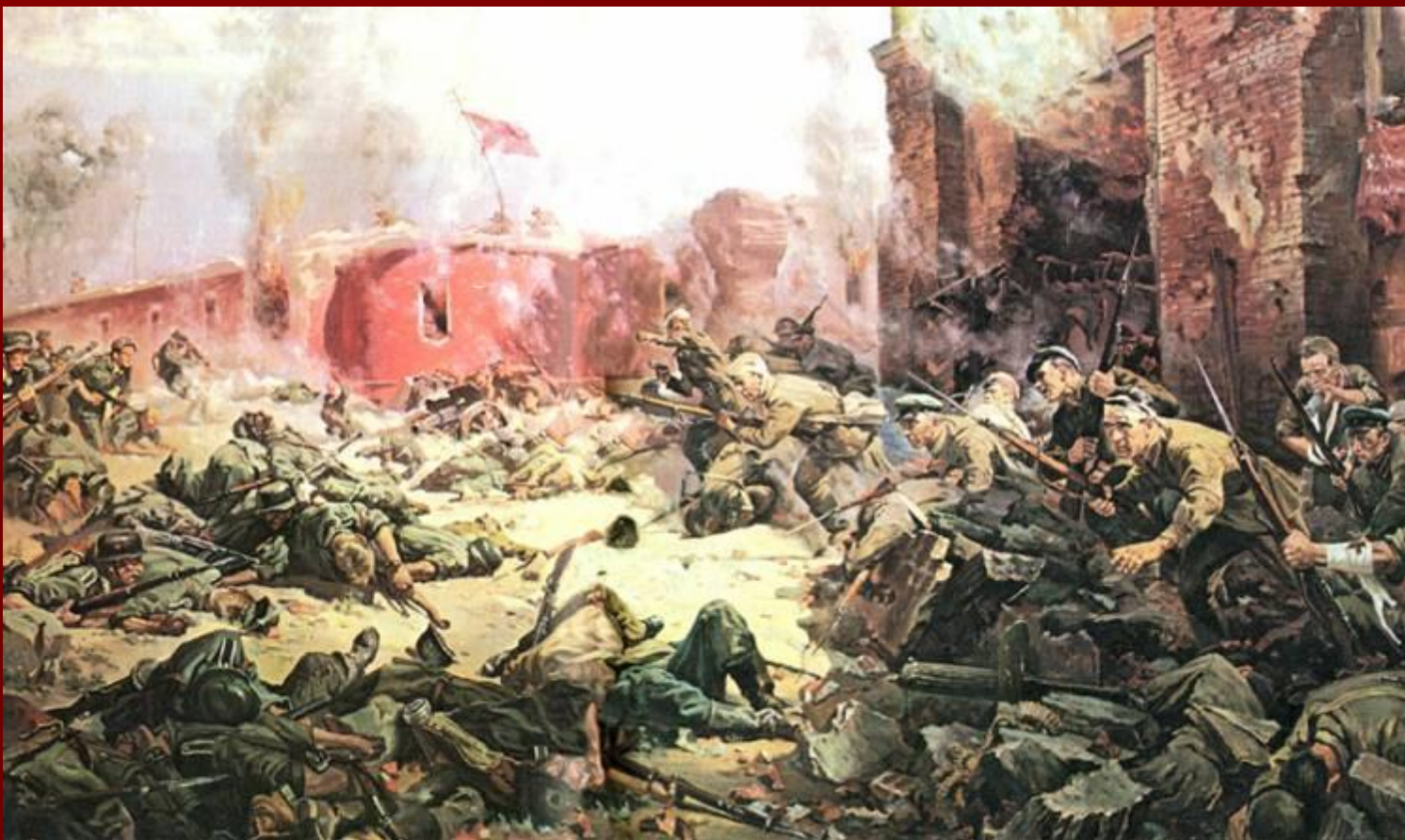
П. А. Кривоногов. «Защитники Брестской крепости».

Гарнизон Брестской крепости, первым приняв на себя удар гитлеровских войск в июне 1941 года, оказал ожесточенное сопротивление. В то время как немцы продвинулись далеко на восток, бои в крепости продолжались больше месяца.