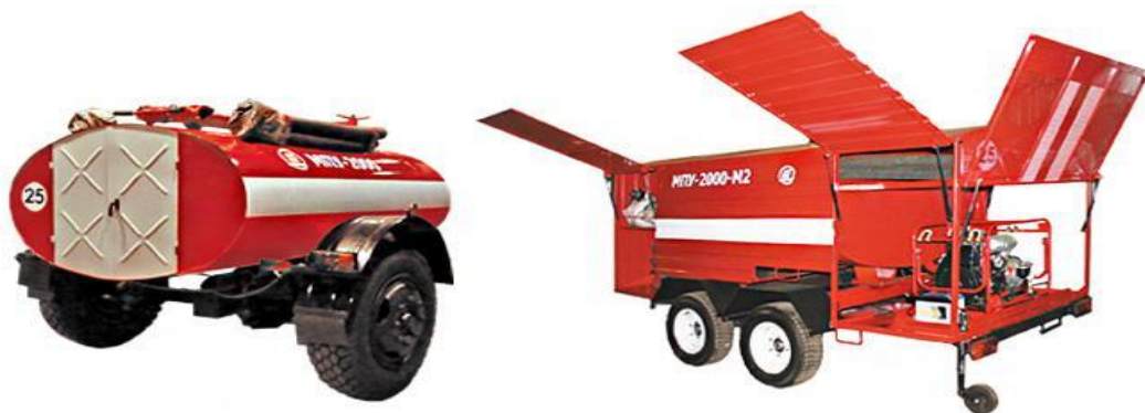
Мобильные пожарные установки МПУ-2000, МПУ-2000-М2