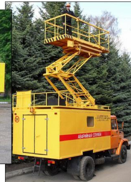
Подъемник стреловой самоходный