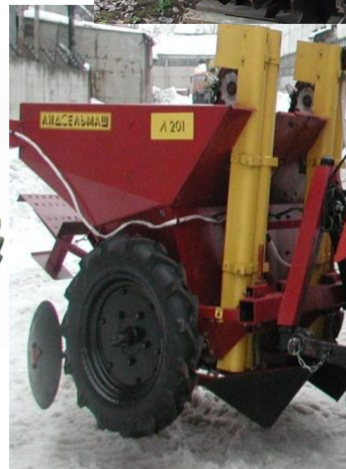
Картофеле- сажалка навесная 2-рядная