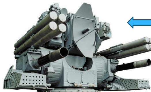
Зенитный ракетно-артиллерийский комплекс КАШТАН