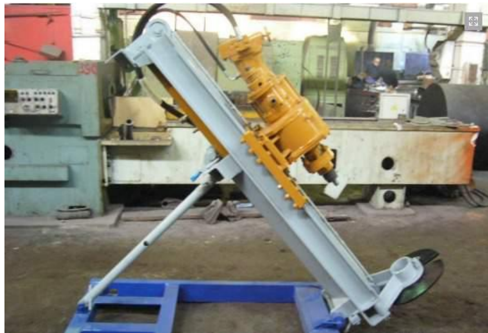
Станки буровые переносные