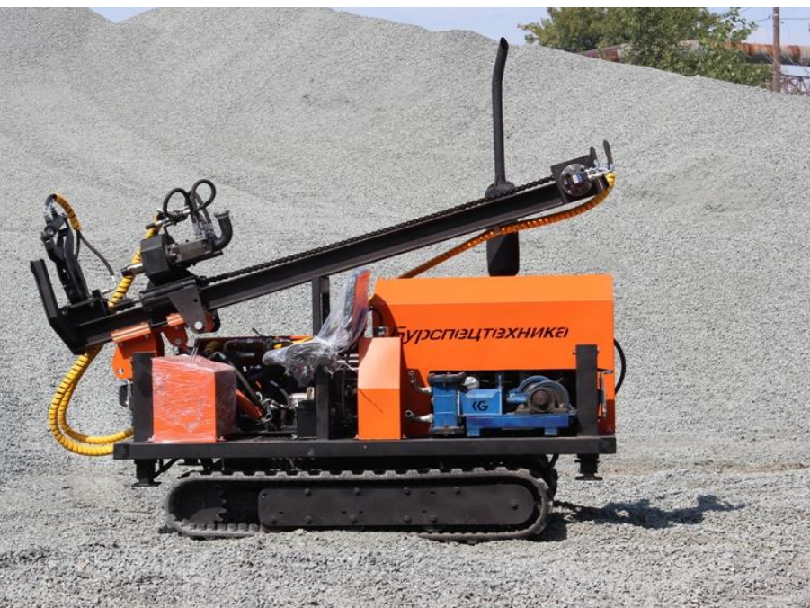
Станки буровые самоходные

Машиностроительное предприятие по производству бурового оборудования и оборудования для бестраншейной прокладки инженерных коммуникаций.