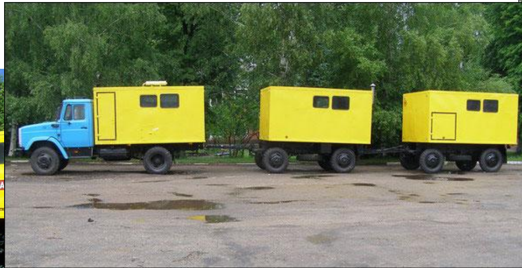
Машина аварийно-техническая путевая