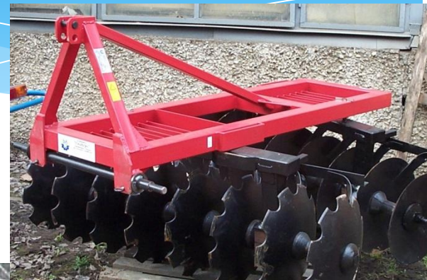
Борона дисковая навесная БДН-1,6