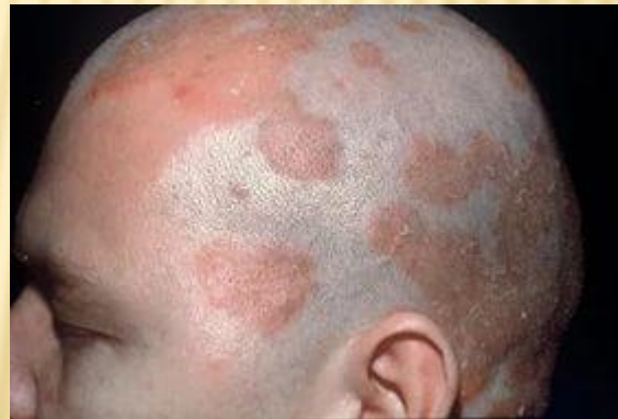
Дерматит (кожная болезнь)