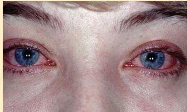
Конъюнктивит (глазная болезнь)