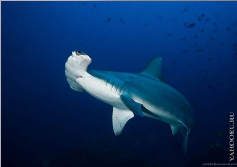
Рыба - Молот