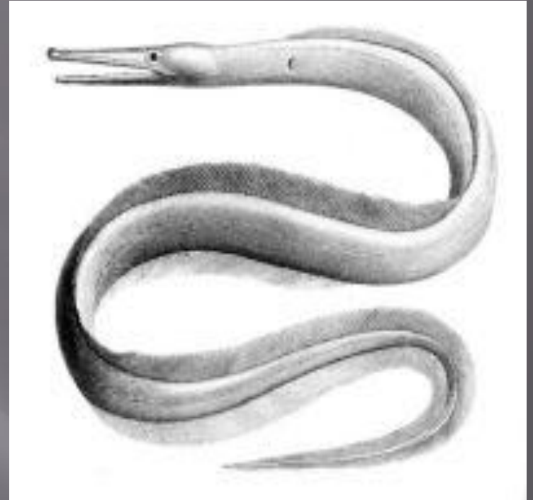
Морской угорь, обитающий только в прибрежных водах Атлантического океана и в западной части Средиземного моря. Имеет прозвище «колдун-черный плавник».