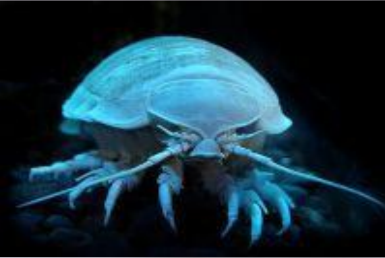
Гигантские изоподы крупные равноногие раки.