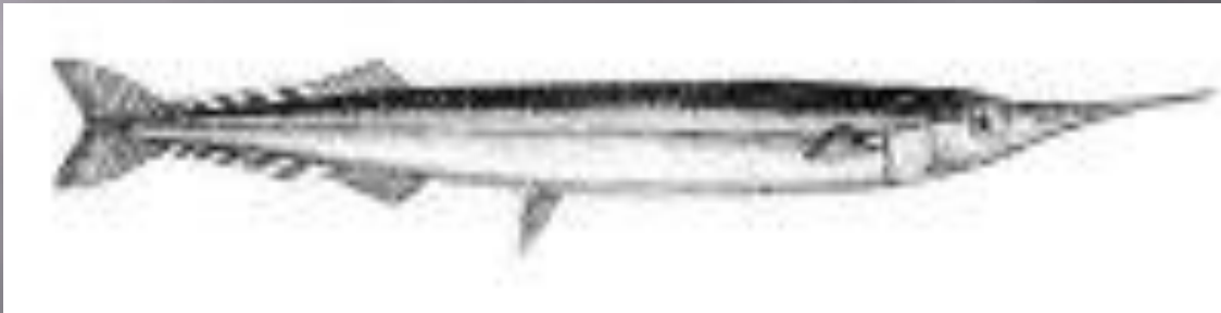
Рыба-стрела (Обыкновенный сарган) стайная морская рыба