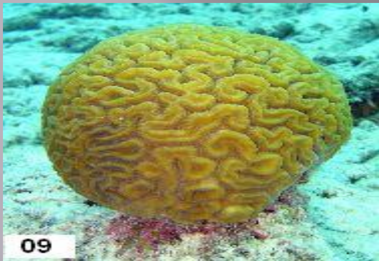
Коралл - мозговик