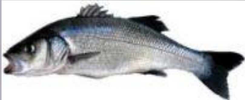
Морской волк рыба семейства Мороновых