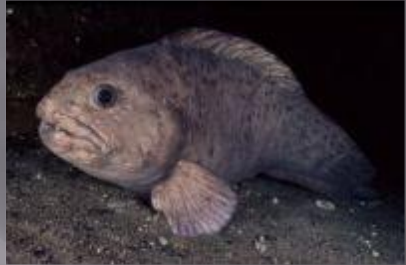
Северная зубатка крупная морская рыба