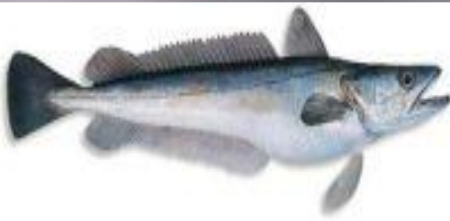
Европейский хек (Европейская мерлуза)- эндемик Атлантического океана