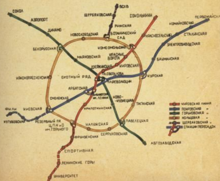
СХЕМА ЛИНИЙ МЕТРОПОЛИТЕНА Г. МОСКВЫ