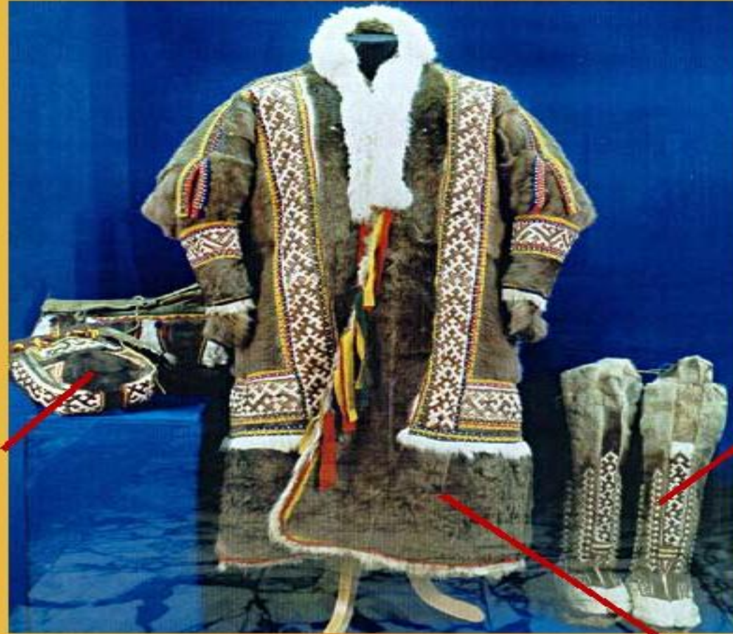
ПИМЫ, ЛИПТЫ - обувь