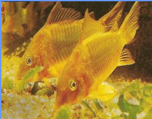
Сомики - настоящие «мусорщики»