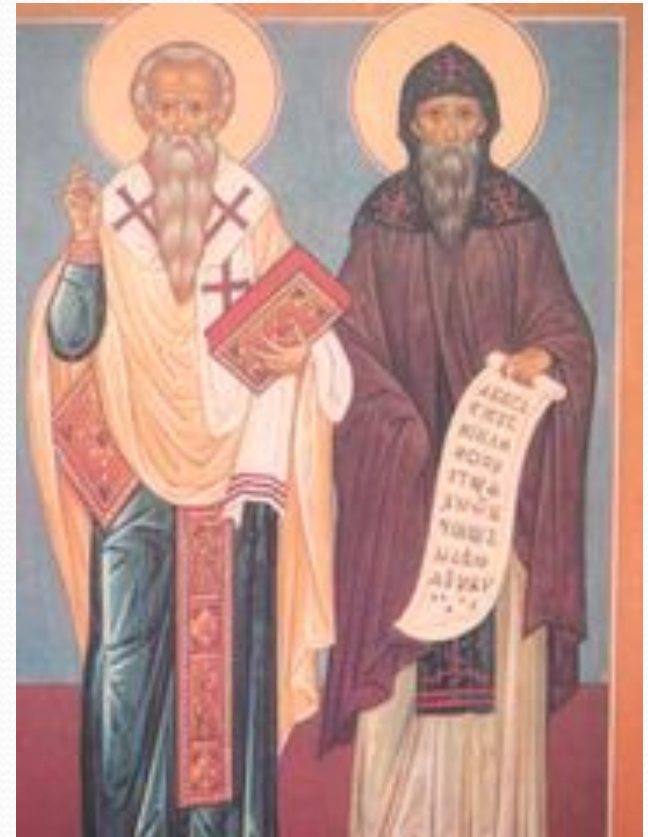
Кирилл и Мефодий

Кто считается создателем славянской письменности?