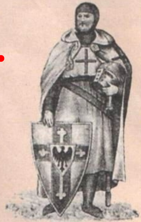
Немецкий рыцарь ордена меченосцев XIII (13) в.

Крестоносцы – шведские и немецкие рыцари.