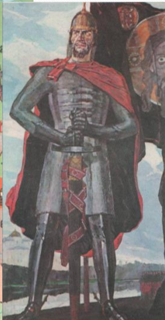
Александр Невский. Художник П. Д. Корин. 1942 г.