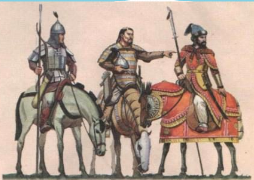
Воины монгольской армии