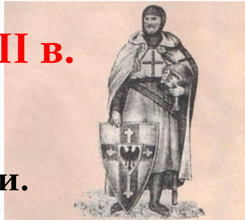
Немецкий рыцарь ордена меченосцев XIII (13) в.

Крестоносцы – шведские и немецкие рыцари.