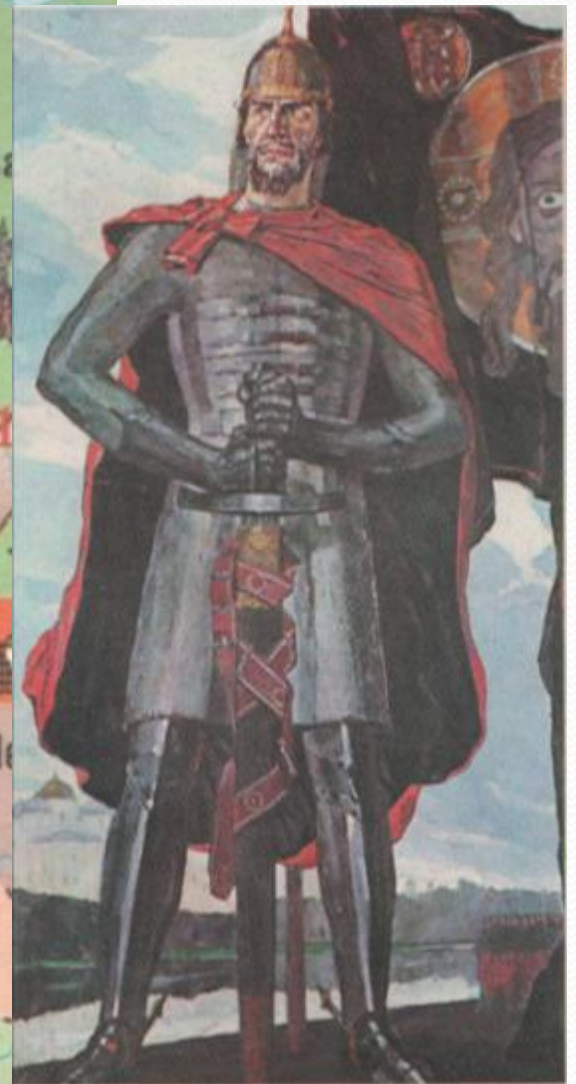
Александр Невский. Художник П. Д. Корин. 1942 г.