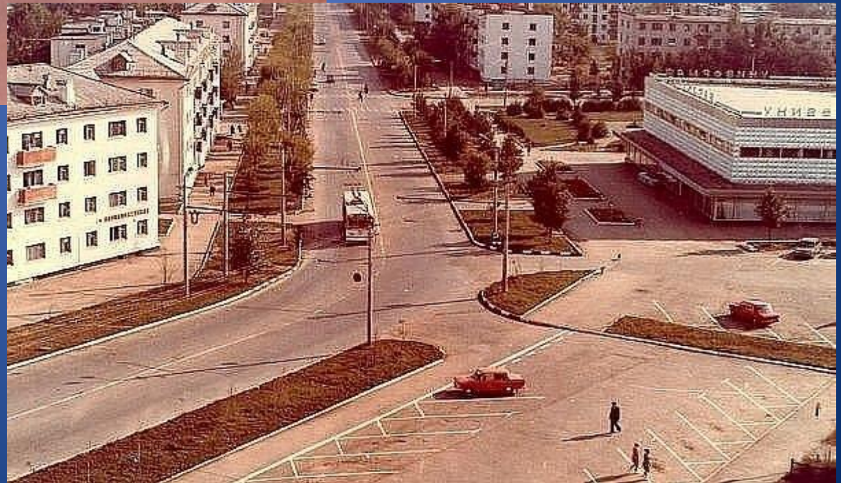
Улица Ленина, универмаг «Татарстан»