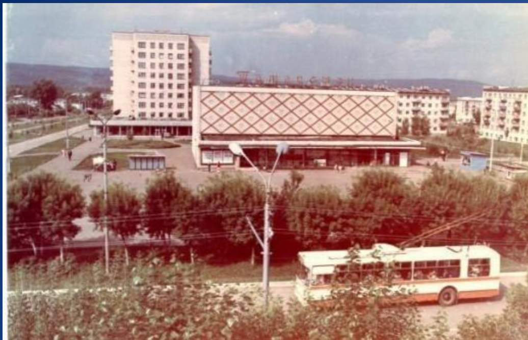
Улица Ленина, кинотеатр «Татарстан»