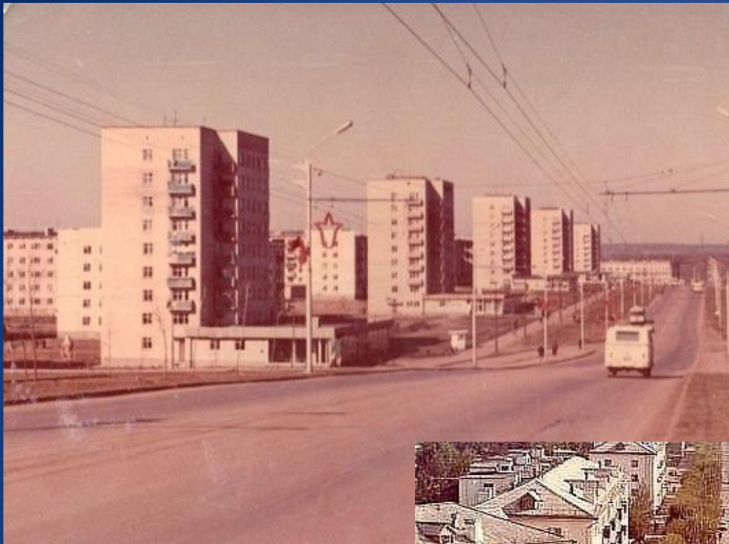
Улица Ленина, 1-й микрорайон