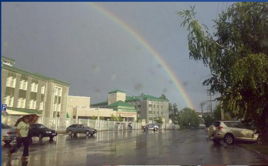
Медико-санитарная часть ОАО «Татнефть» и города Альметьевск