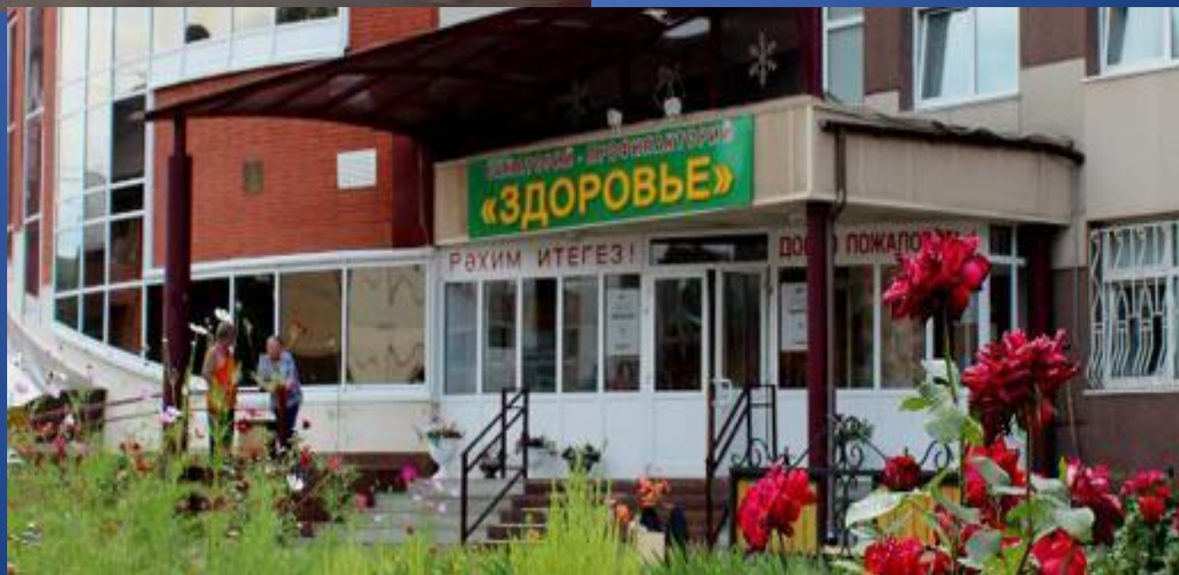
Санаторий- профилакторий «Здоровье»