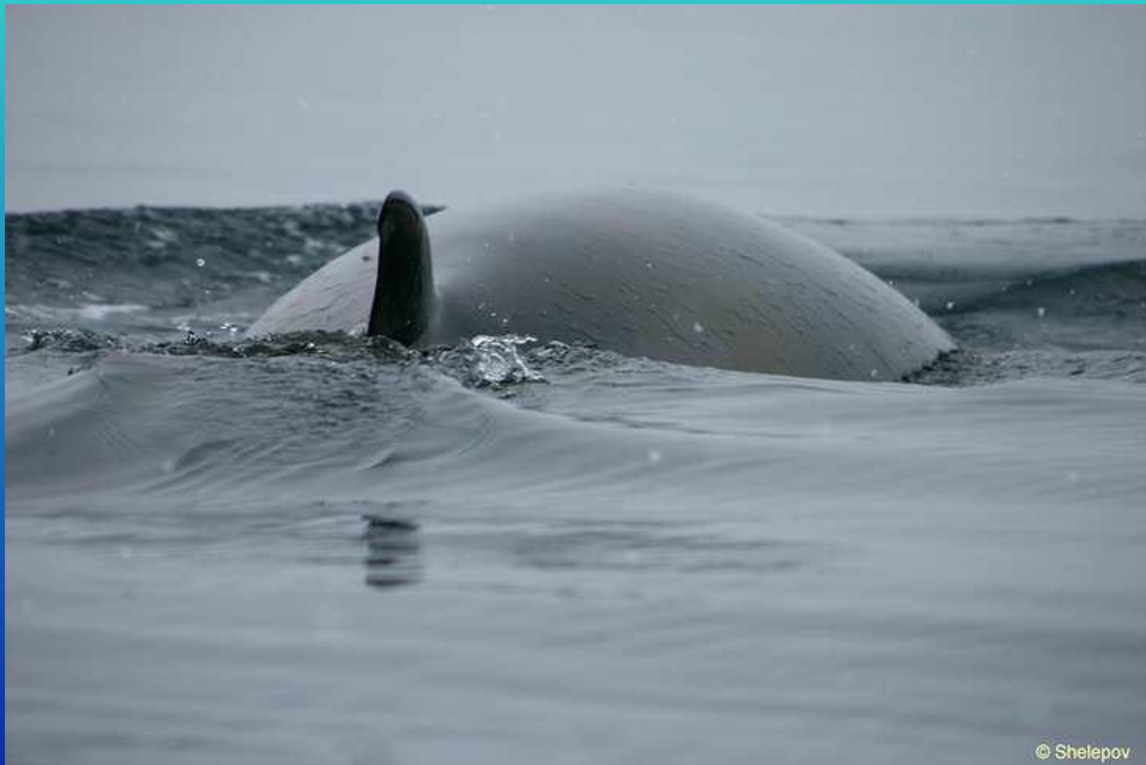
Кит малый полосатик