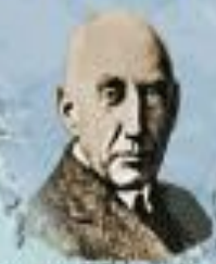
Р. Адмундсен 1912 г.