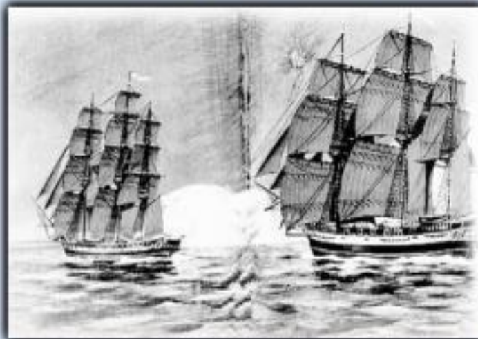
Шлюпы Восток и Мирный

Антарктида была открыта последней из материков Земли. Существование Южного материка предполагалось очень давно, на старинных картах его часто объединяли с Южной Америкой или с Австралией, получившей название в честь этой гипотетической части суши. И только экспедиция Беллинсгаузена и Лазарева в южно-полярных морях на шлюпах «Восток» и «Мирный» подтвердила факт наличия шестого материка Земли. Это случилось 16 (28) января 1820 года (официальная дата открытия Антарктиды) в районе современного шельфового ледника Беллинсгаузена.