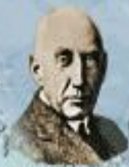
Р. Адмундсен 1912 г.