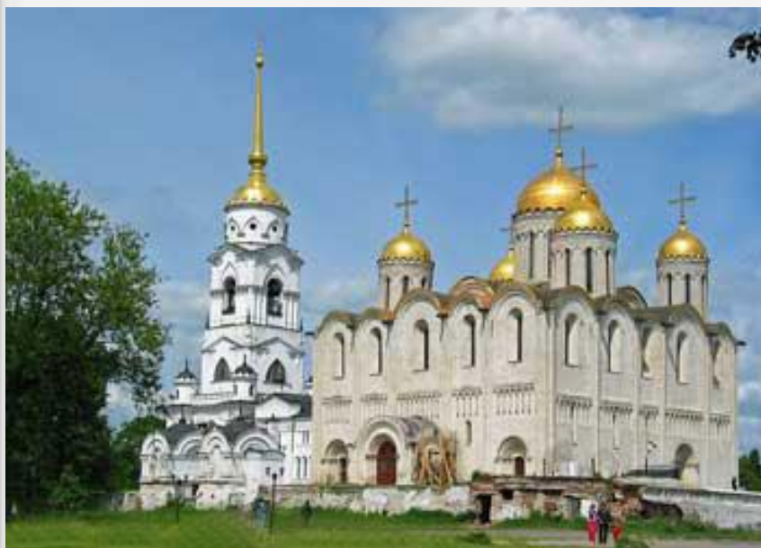
Успенский собор 1185-1189 Владимир

Просторна и светла Соборная площадь Кремля. Архитектурный ансамбль, возведенный на ней более 500 лет назад, неповторим по своей красоте и великолепию. Здесь и величественные храмы-богатыри, и храмы легкие, причудливые, словно игрушечные в сравнении с ними. Ныне существующие соборы стоят на месте более древних. Первостепенную роль в ансамбле Соборной площади играет Успенский собор. Исследователи считают, что ему предшествовали три храма: деревянная церковь XII века, Дмитровский собор XIII века и белокаменный храм времен Ивана Калиты.