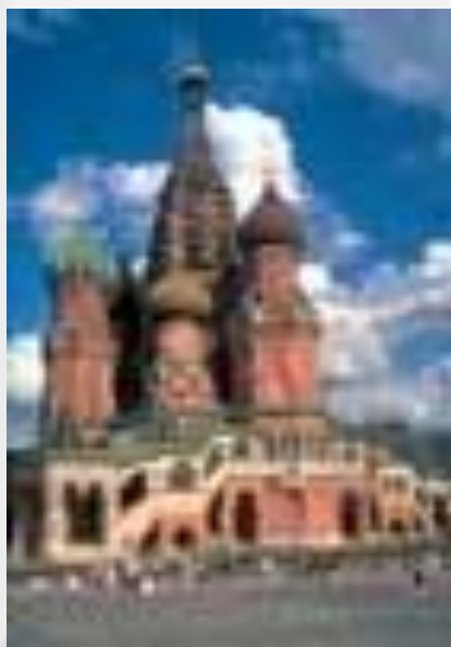
Храм Покрова на рву зодчие Барма, Постник 1555-1561 Москва

Когда русские войска взяли Казань и прочно утвердились на волжских берегах, повелел царь Иван Грозный поставить у стен московского Кремля церковь о восьми главах — по числу одержанных побед. Недавно возвратился он из похода, с великим ликованием встречала его Москва: звонили колокола, люди со смехом и рыданиями бросали праздничные одежды под копыта царского коня: у многих родные и близкие томились в ордынском плену. Любимая супруга Анастасия Романовна разрешилась от бремени наследником — это тоже был праздник. Летопись гласит: "...царь и великий князь Иван Васильевич... повеле поставити храм Покрова с пределы о Казанской победе, что бог покорил безсерманский род казанских татар царю...". Увековечить эту победу поручили гениальным зодчим Барме и Постнику. Ходят легенды, что после окончания строительства царь велел выколоть глаза архитекторам, чтобы они больше ничего подобного построить не смогли.