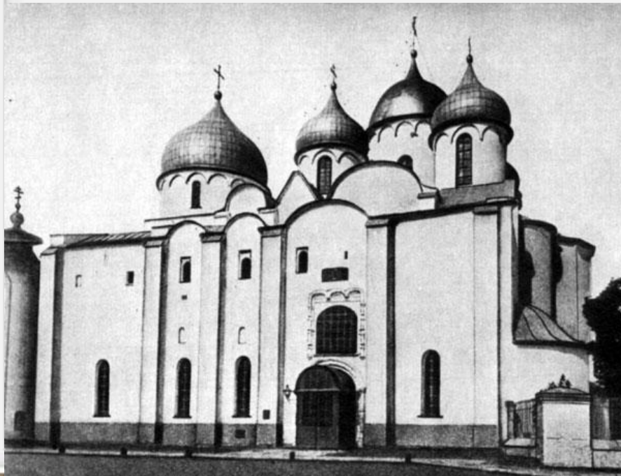
Собор Святой Софии в Новгороде 1045-1052 Новгород

Новгородский собор св.Софии. Ярослав Мудрый до конца жизни своей был благодарен новгородцам, посадившим его на киевский престол. Дал он им в князя любимого своего сына — Владимира, а когда тот с новгородской дружиной по отцовскому приказу разбил волжских болгар и захватил богатую добычу, Ярослав не поскупился: все отдал Новгороду. И решили новгородцы возвести у себя Новгородский Софийский собор, увенчанный пятью главами. Софию Новгородскую строили семь лет, и освящение ее состоялось в 1052 году. Святой князь Владимир по освящении собора прожил менее месяца, скончался 4 октября 1052 года и похоронен был в церкви Святой Софии.