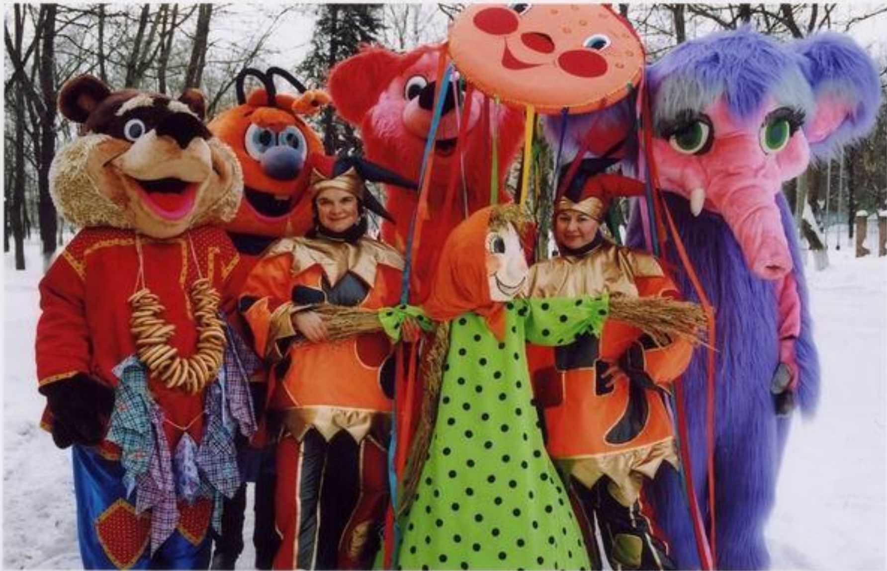
Ряженые веселили народ.