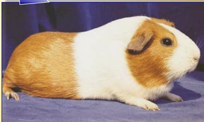
Морская свинка – лабораторное животное

Незаменима она при изучении вопросов, связанных с питанием человека и, особенно при изучении действия витамина С.