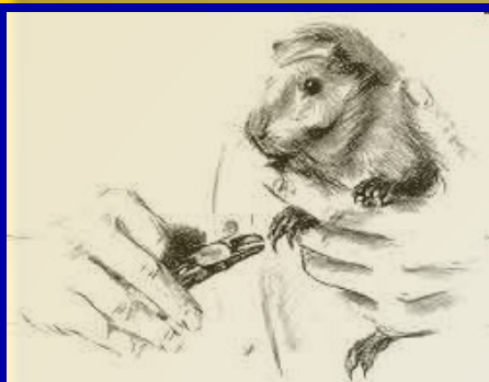
Так следует держать в руке морскую свинку при подстригании когтей.