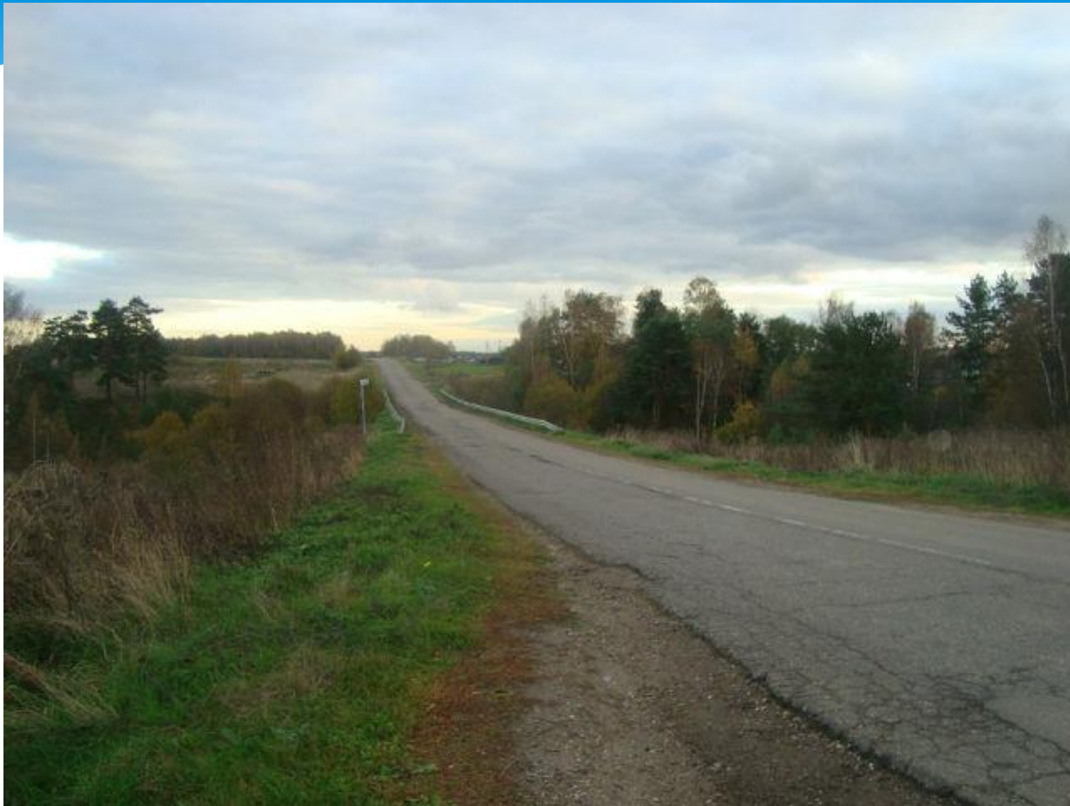
Дорога в Александров.