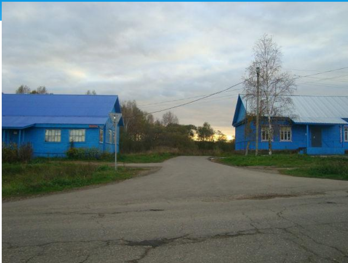
Здания почты, сельской библиотеки и дома культуры.