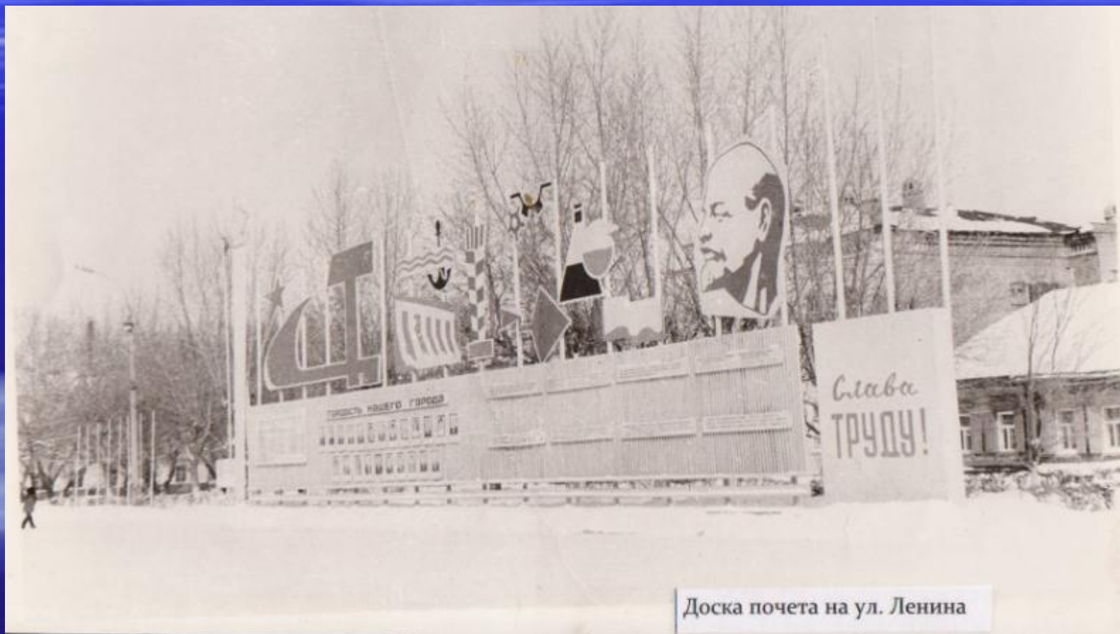
Доска почета на ул. Ленина