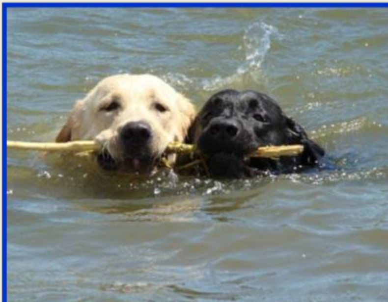
Найт и Бадди купаются

Найт и Банни очень дружат. Я для них - лучший друг. Мне очень нравится играть с ними. Мы бываем в лесу, вместе бегаем и веселимся, зимой катаемся с горки и играем в снежки, летом вместе купаемся. Найт все время хочет меня спасти, когда думает, что я слишком далеко заплыл.