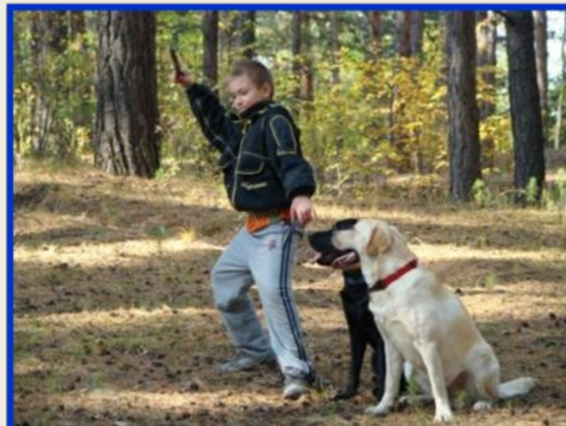
Учим команду «Аппорт!»