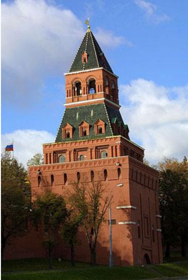
Константино - Еленинская башня Московского Кремля

Константино - Еленинская Башня (Тимофеевская). Её построили в 1490 году и использовали для прохода населения и войска в Кремль. Раньше, когда Кремль был белокаменным, на этом месте стояла другая башня. Именно через неё Дмитрий Донской с войском выезжал на Куликово поле. Новую башню построили по той причине, что с её стороны не у Кремля не было естественных преград. Её оснастили подъёмным мостом, мощной отводной стрельницей и проездными воротами, которые после, в 18-начале 19 вв. были разобраны. Своё название башня получила по имени церкви Константина и Елены, стоявшей в Кремле. Высота башни 36,8м.