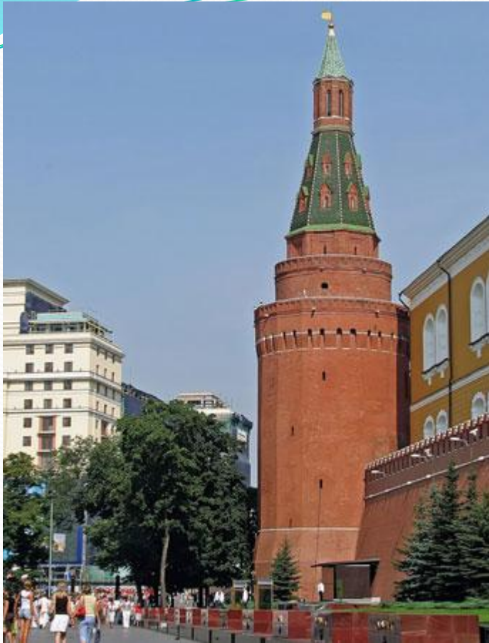
Угловая Арсенальная башня Московского Кремля

Идём дальше по Кремлёвской стене. Она снова поворачивает. Здесь стоит ещё одна башня. Издалека она кажется круглой, но если подойти ближе, она оказывается вовсе не такой, потому что у неё 16 граней. Это угловая Арсенальная башня . Когда-то её называли Собакиной, по фамилии жившего рядом человека. Но в 18 столетии по соседству с ней возвели здание Арсенала , и башню переименовали. В подzemелье угловой Арсенальной башни есть колодец. Ему больше 500 лет. Он наполняется из древнего источника и потому в нём всегда чистая и свежая вода. Раньше от Арсенальной башни шёл подземный ход к реке Неглинной. Высота башни 60,2 м.