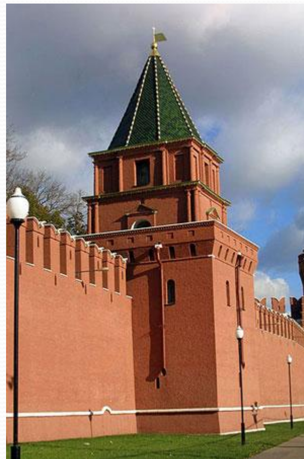
Петровская башня Московского Кремля

Петровская башня вместе с двумя безымянными была построена для усиления южной стены, как наиболее часто подвергавшейся нападению. Как и две безымянные Петровская башня сначала не имела названия. Имя своё она получила от церкви митрополита Петра на Угрешском подворье в Кремле. В 1771г. во время строительства Кремлёвского дворца башню, церковь митрополита Петра и Угрешское подворье разобрали. В 1783г. башню отстроили заново, но в 1812г. французы во время оккупации Москвы уничтожили её снова. В 1818г. Петровскую башню снова восстановили. Её использовали для своих нужд кремлёвские садовники. Высота башни 27,15м.