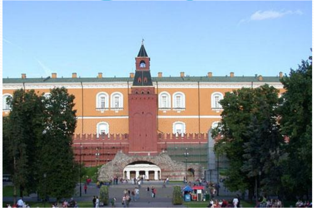
Средняя Арсенальная башня Московского Кремля

Средняя Арсенальная башня. Её построили в 1493-1495 гг. После постройки здания Арсенала башня получила своё название. Возле башни в 1812 г. был возведён грот – одна из достопримечательностей ей Александровского сада. Высота башни 38,9м.