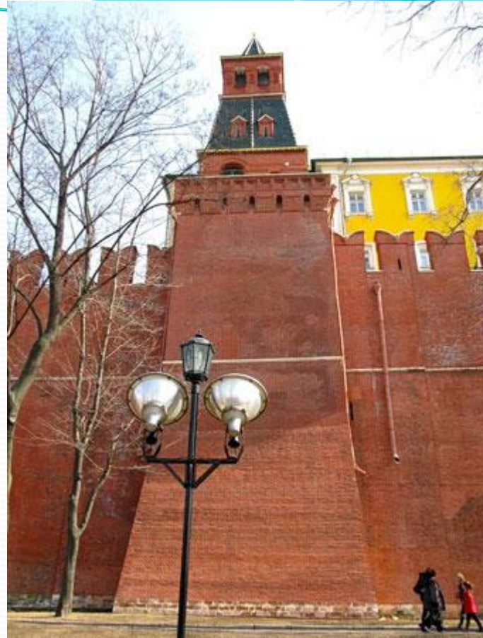
Благовещенская башня Московского Кремля

Благовещенская башня. По легенде в этой башне раньше хранилась чудотворная икона «Благовещение», а также в 1731г. к этой башне пристроили церковь Благовещения. Скорее всего, название башни связано с одним из этих фактов. В 17в. для прохода прачек к Москве-реке возле башни были сделаны ворота, названные Портомойными. В 1831г. их заложили, а в советское время разобрали и церковь Благовещения. Высота Благовещенской башни с флюгером 32,45 м.