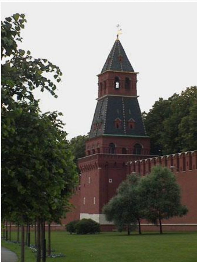
Благовещенская башня Московского Кремля

Благовещенская башня. По легенде в этой башне раньше хранилась чудотворная икона «Благовещение», а также в 1731г. к этой башне пристроили церковь Благовещения. Скорее всего, название башни связано с одним из этих фактов. В 17в. для прохода прачек к Москве-реке возле башни были сделаны ворота, названные Портомойными. В 1831г. их заложили, а в советское время разобрали и церковь Благовещения. Высота Благовещенской башни с флюгером 32,45 м.