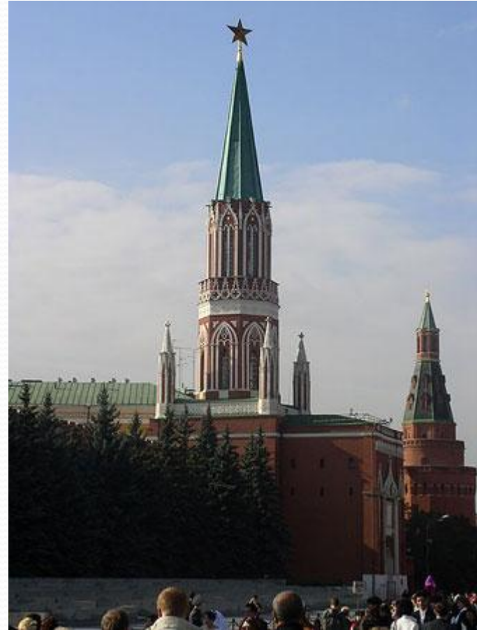
Никольская башня Московского Кремля

Никольская башня. Была построена в 1491г. архитектором Пьетро Антонио Солари для укрепления северо-восточной части Кремля, не защищённой естественными преградами. В ней находились ворота, она имела отводную стрельницу с подъёмным мостом. Отводной стрельницей или барбаканом называли башню за пределами крепостных стен, охранявшую подступы к воротам или мосту. Например, барбаканом является Кутафья башня. Название Никольской башни произошло от имени иконы св. Николая, установленной над воротами её барбакана. У этой иконы решали спорные вопросы. В древности на башне тоже были установлены часы. Сейчас их там нет, зато маковицу башни венчает красная звезда. Высота башни со звездой 70,4м.