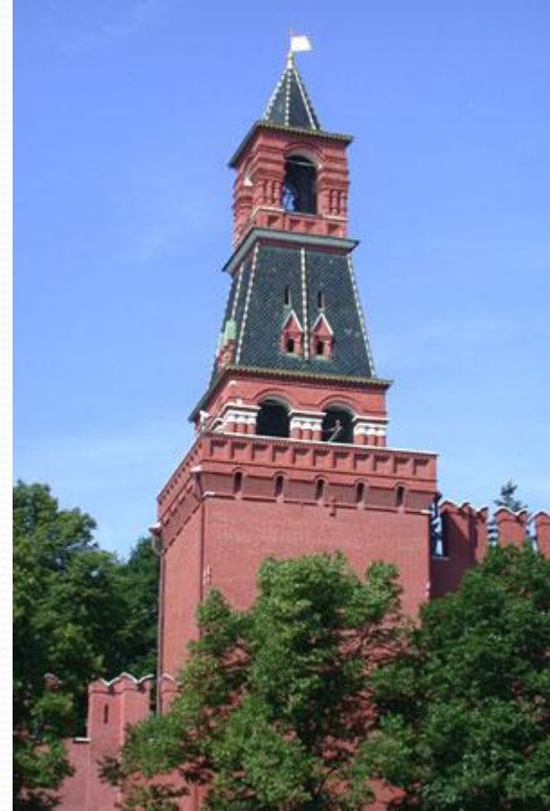
Набатная башня Московского Кремля

Набатная башня. Когда-то здесь постоянно дежурили дозорные. С высоты они зорко следили – не идёт ли вражье войско к городу. И если приближалась опасность, дозорные должны были предупредить всех, ударить в набатный колокол. Из-за него башню и назвали Набатной. Но сейчас в башне нет колокола. Однажды в конце 18 века по удару Набатного колокола в Москве начался бунт. А когда в городе восстановился порядок, за разглашение недоброй вести колокол наказали – лишили языка. В те времена это была обычная практика, вспомнить хотя бы историю колокола в Угличе . С тех пор Набатный колокол замолчал и долго оставался без дела, пока его не убрали в музей. Высота Набатной башни 38 м.