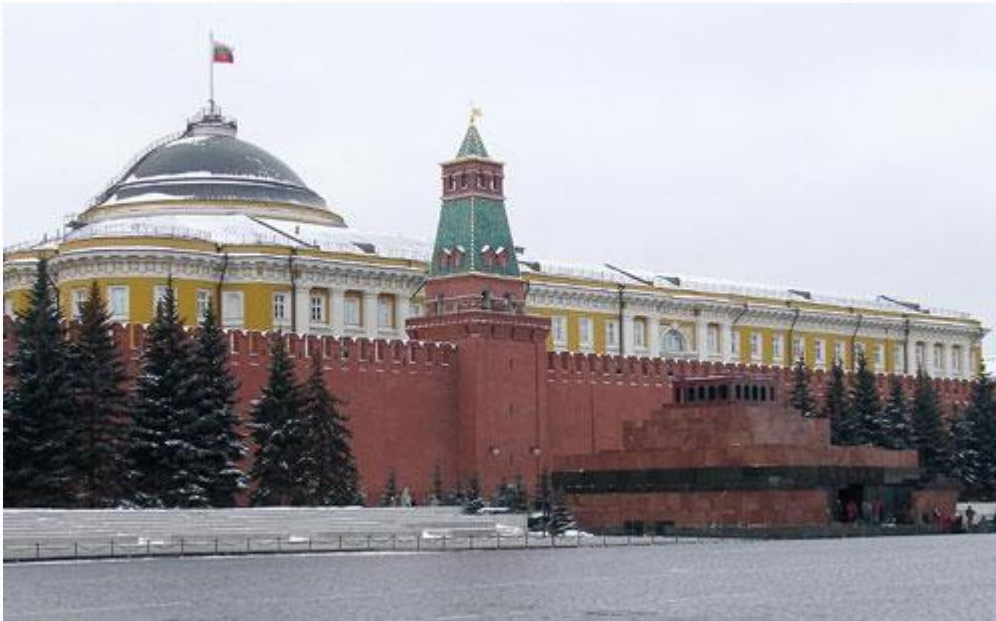
Сенатская башня Московского Кремля

Сенатская башня сначала не имела названия, и получила его только после строительства здания Сената. После чего её и стали величать Сенатской. Построили башню в 1491 г., её высота 34,3 м.