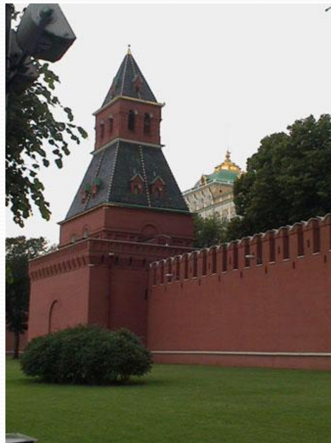
Тайницкая башня Московского Кремля

Первой башней, которая была заложена при строительстве Кремля, была Тайницкая. Тайницкая башня названа так потому, что от неё к реке вёл тайный подземный ход. Предназначался он для того, чтобы можно было брать воду в случае если крепость осадят враги. Высота Тайницкой башни 38,4 м.