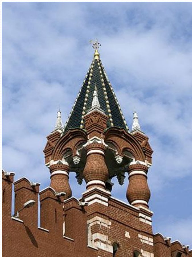
Царская башня Московского Кремля

Справа от Набатной башни находится Царская башня . Она совсем не похожа на другие Кремлёвские башни. Прямо на стене стоят 4 колонны, а на них островерхая крыша. Нет ни мощных стен, ни узких бойниц. Но они ей и ни к чему. Потому что строили башню вовсе не для обороны. По преданию царь Иван Грозный любил с этого места глядеть на свой город. Позже здесь соорудили самую маленькую башню Кремля и назвали её Царской. Высота её 16,7 м.