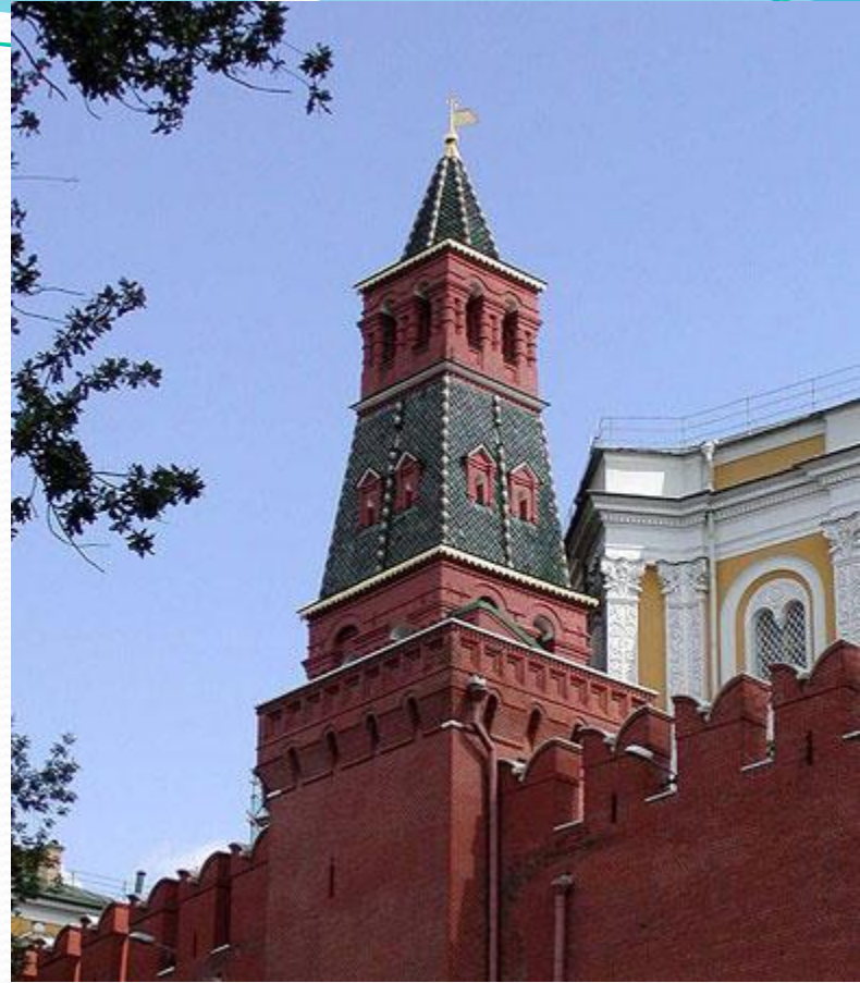
Оружейная башня Московского Кремля

Следующей за Боровицкой идёт Оружейная башня . Когда-то рядом с ней располагались старинные оружейные мастерские. Ещё в них делали драгоценную посуду и украшения. Древние мастерские дали название не только башне, но и замечательному музею, расположенному рядом за кремлёвской стеной – Оружейной палате . Здесь собраны многие кремлёвские сокровища и просто очень древние вещи. Например, шлемы и кольчуги древнерусских ратников. Высота Оружейной башни 32,65 м.