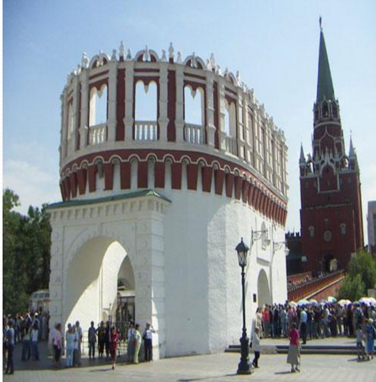
Кутафья и Троицкая башни Московского Кремля

Если пройти чуть дальше вдоль стен Кремля, то мы увидим Троицкий мост. Его перекинули через реку Неглинную много столетий назад, ещё до того как она была спрятана под землю. Троицкий мост ведёт к воротам одной из самых высоких кремлёвских башен – Троицкой . Мост соединяет Троицкую башню с другой – низкой и широкой башней. Это Кутафья башня . В старину так называли неуклюже одетую женщину. Башню принарядили уже в семнадцатом столетии. До этого Кутафья была очень суровой, с подъёмными мостами у боковых ворот и навесными бойницами. Она охраняла въезд на Троицкий мост. Раньше таких предмостных башен было больше. Но до наших дней сохранилась только одна. Высота Троицкой башни со звездой - 80 м. Это самая высокая башня Московского Кремля. Кутафья башня в высоту всего 13,5 м. Это самая низкая башня Кремля.