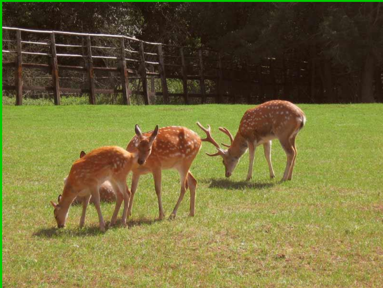
Минск 2008г.

Российской империи ездили на охоту не в Сибирь, а в Беларусь - в имения Тизенгауза в Поставах... В тех краях и сделан этот снимок.