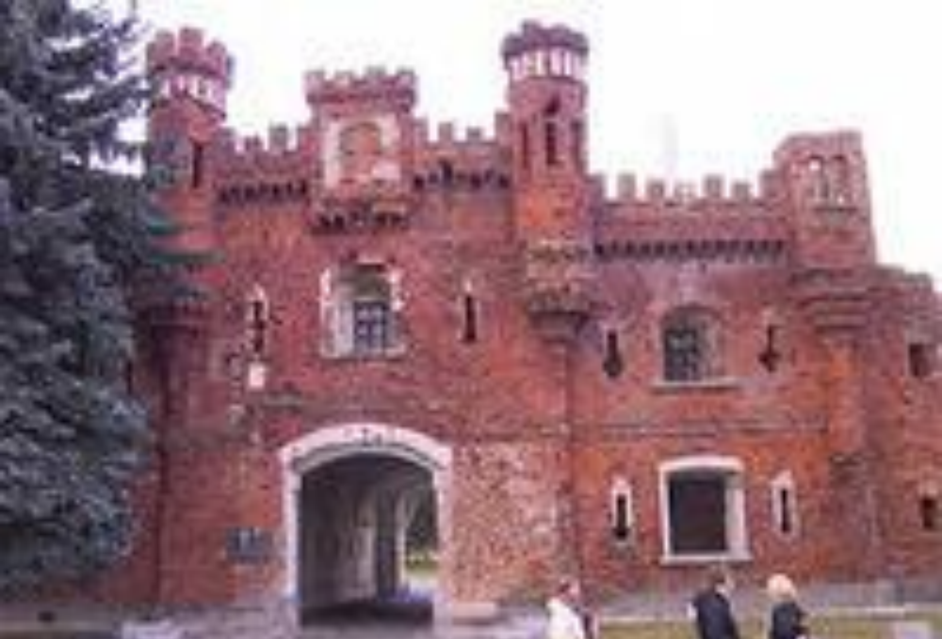
Холмские ворота – символ Брестской