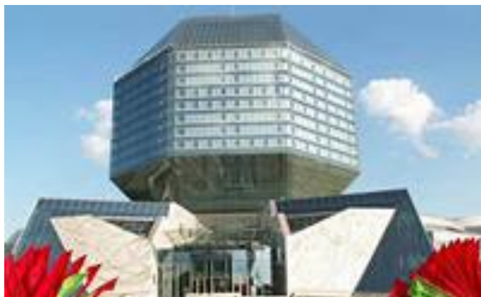
Здание национальной Библиотеки