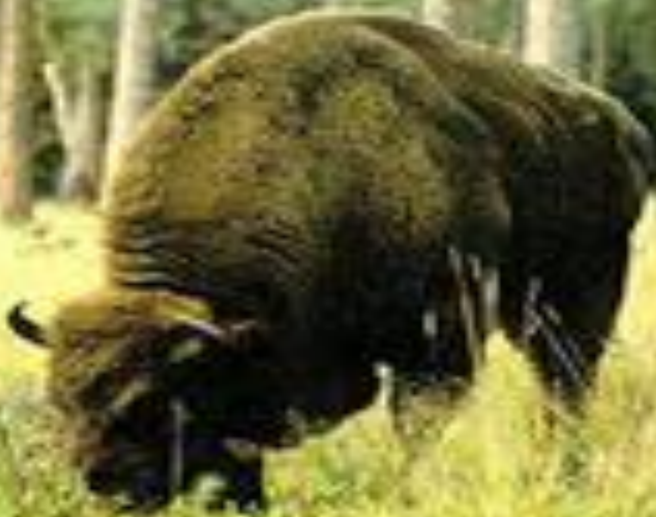
Гордость заповедника - зубры