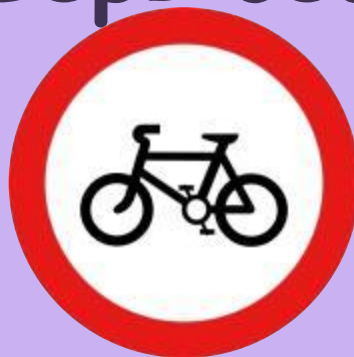
Движение на велосипедах запрещено