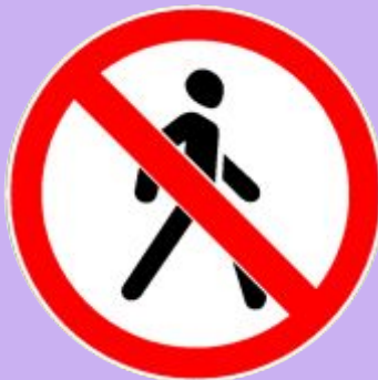
Движение пешеходов Подземный переход запрещено