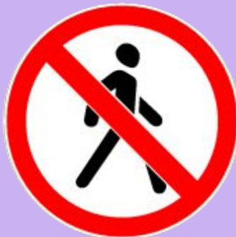
Движение пешеходов Подземный переход запрещено