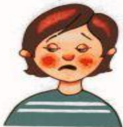
Рис. 1. Обида

Задание 34. Посмотрите внимательно на рисунки. На них нарисованы ученики с разными эмоциями. Постарайтесь определить, в каком случае могли возникнуть те или другие эмоции. Для этого в тетради выпишите номера рисунков и напротив каждого из них поставьте номер ситуации.