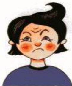
Рис. 2. Злость