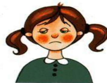
Рис. 6. Печаль