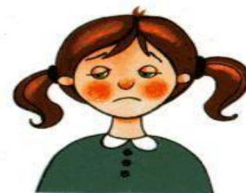
Рис. 6. Печаль