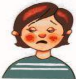
Рис. 1. Обида

Задание 34. Посмотрите внимательно на рисунки. На них нарисованы ученики с разными эмоциями. Постарайтесь определить, в каком случае могли возникнуть те или другие эмоции. Для этого в тетради выпишите номера рисунков и напротив каждого из них поставьте номер ситуации.