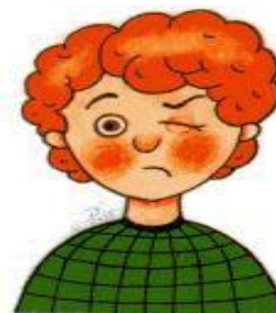
Рис. 5. Досада