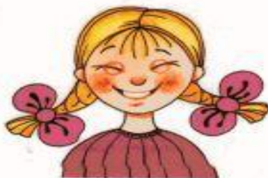
Рис. 4. Радость