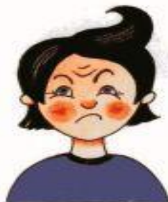
Рис. 2. Злость