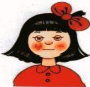
Рис. 3. Равнодушие