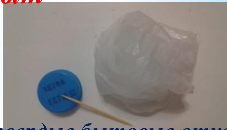
твердые бытовые отходы