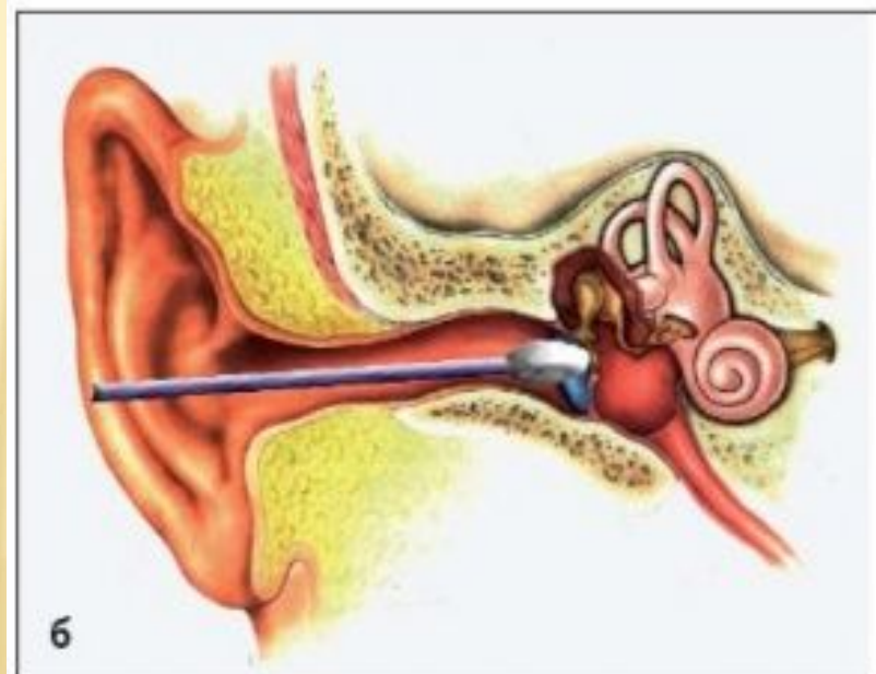
Рис. 2. Неправильное использование ватных палочек