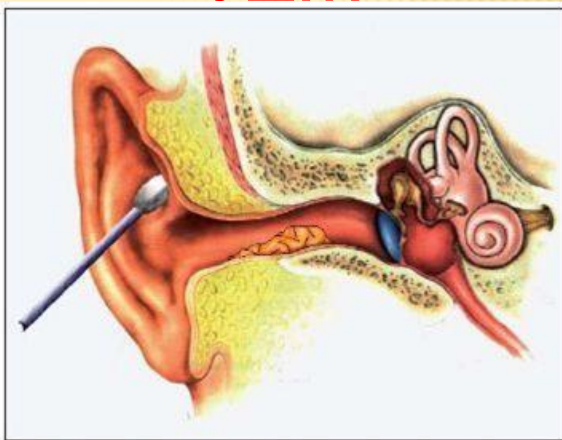
Рис. 1. Правильное использование ватных палочек с целью гигиены наружного уха