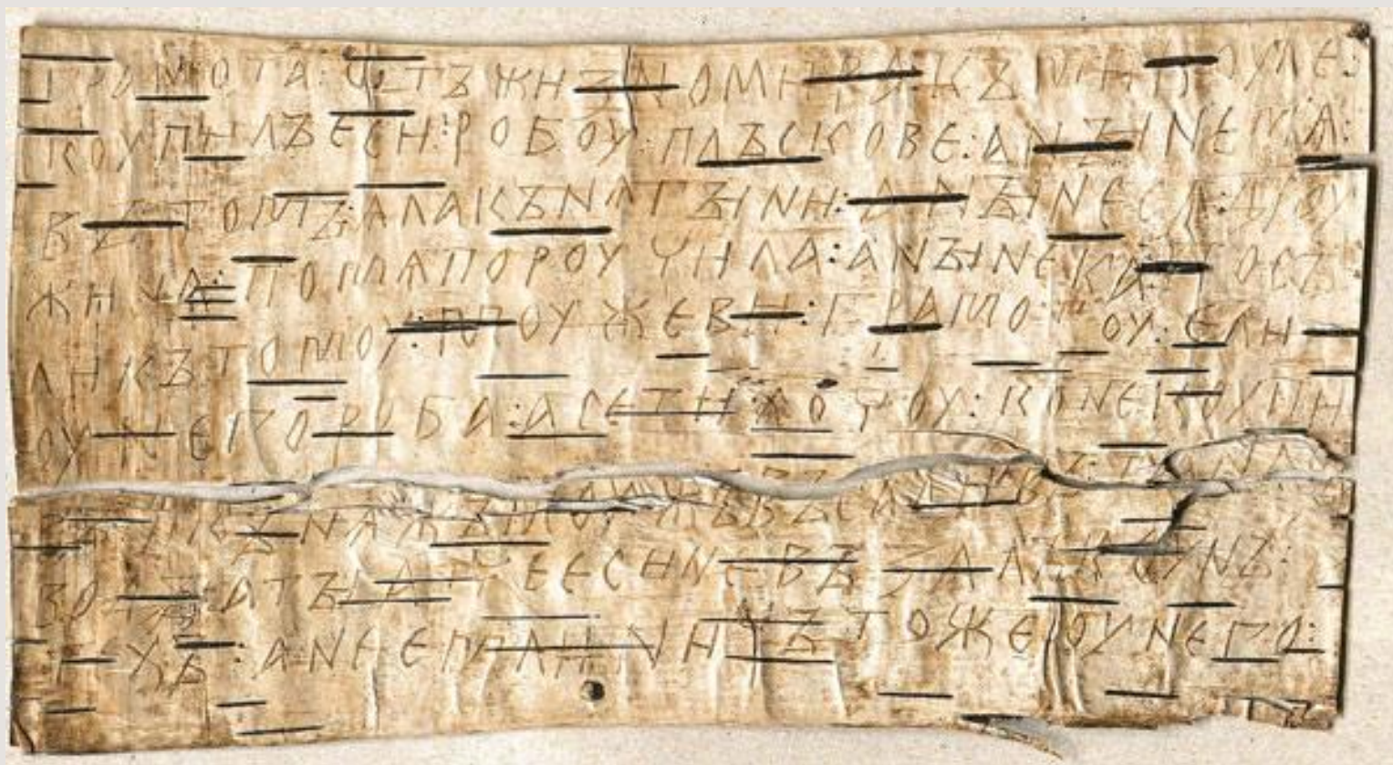
Берестяные грамоты. XI –XIV век