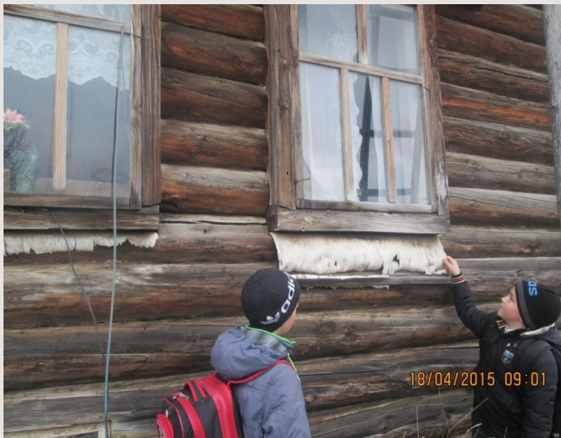
Дом (д. Самарово)