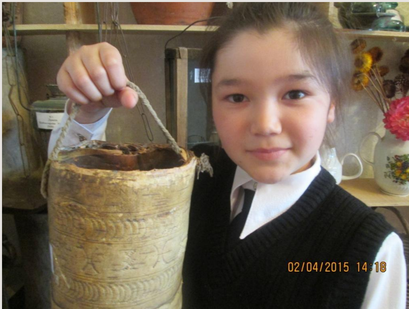
Туесок с орнаментальным узором