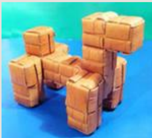
Собачка из бересты