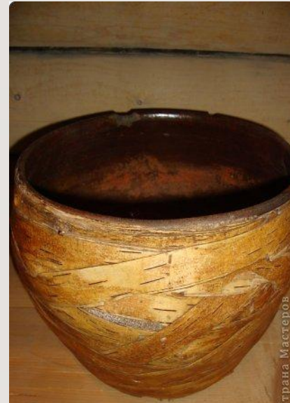
Горшок, обвитый берестой