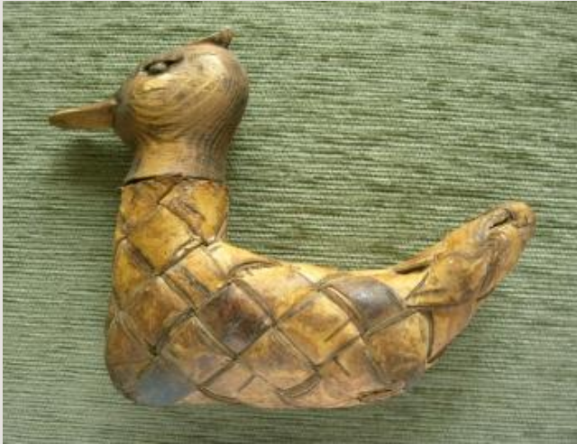
Солонка в виде уточки