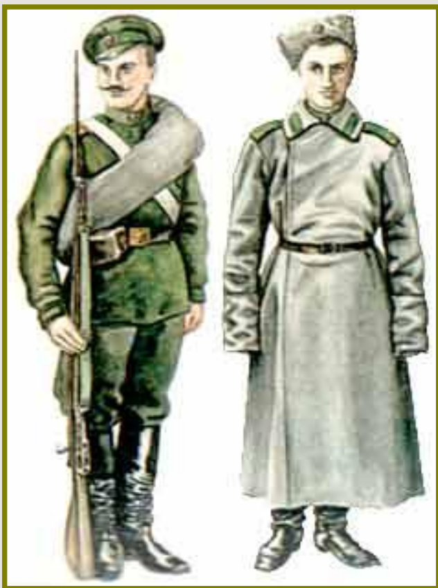
Сапоги со стельками из бересты