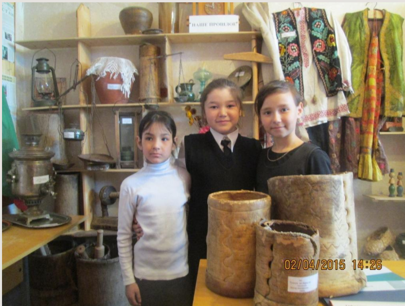
Школьный краеведческий музей