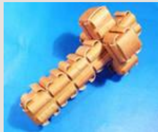
Погремушка - шаркунок