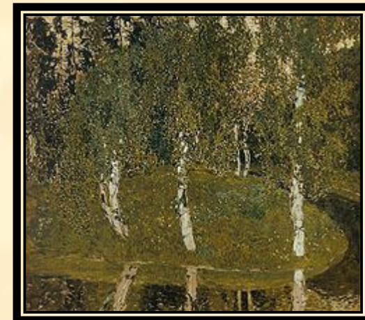
Александр Головин . Берёзки. 1908—1911. Бумага, гуашь. Государственная Третьяковская галерея