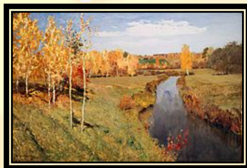
Исаак Левитан . Золотая осень. 1895. Холст, масло. Государственная Третьяковская галерея

Государственная Третьяковская галерея, Государственный Русский музей.