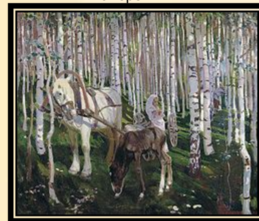
Аркадий Рылов . В лесу. 1905. Холст, масло. Кировский областной художественный музей имени В. М. и А. М. Васнецовых.