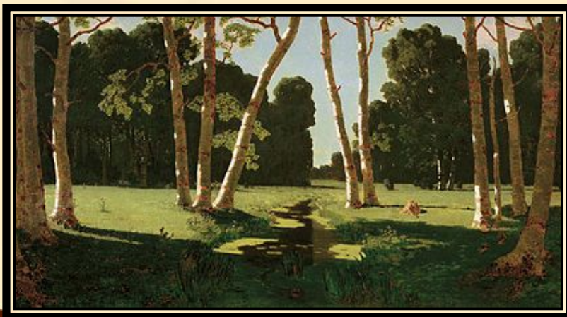
Архип Куинджи . Берёзовая роща. 1879. Холст, масло. Государственная Третьяковская галерея