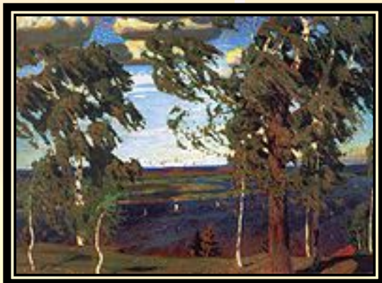
Аркадий Рылов . Зелёный шум. 1904. Холст, масло.

Государственная Третьяковская галерея, Государственный Русский музей.