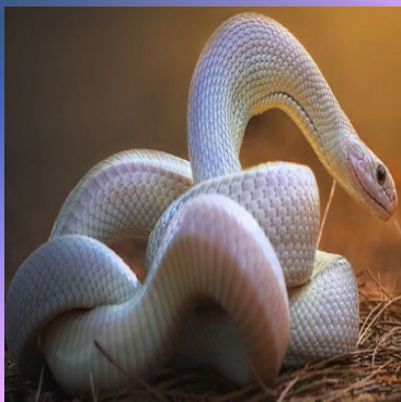
Крысины й полоз