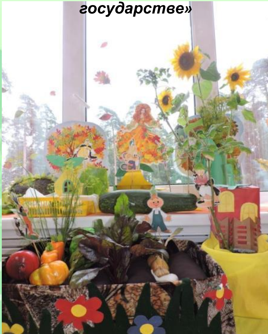
Собирали урожай уже осенью