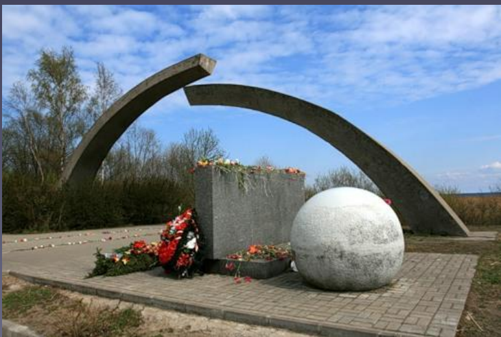
Мемориал на берегу Ладожского озера «Разорванное кольцо»