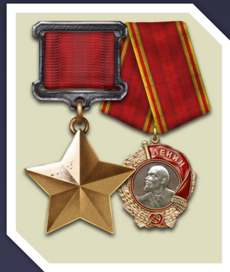
Орден Ленина и медаль «Золотая звезда»