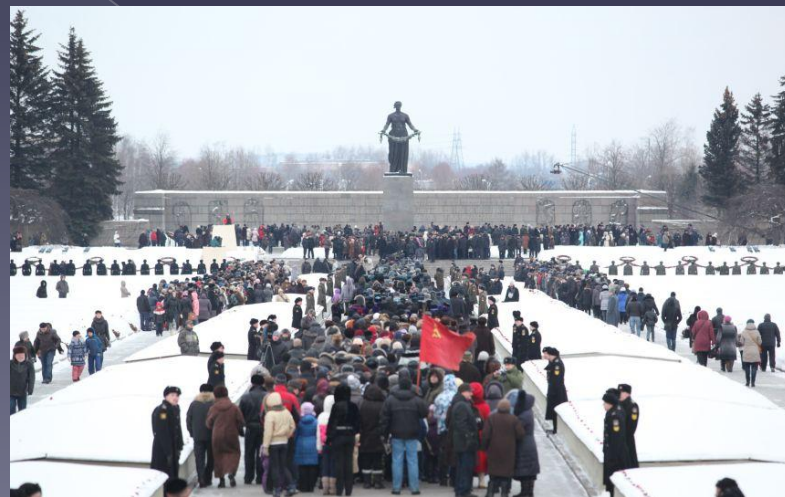
Монумент «Мать-Родина» на Пискаревском кладбище