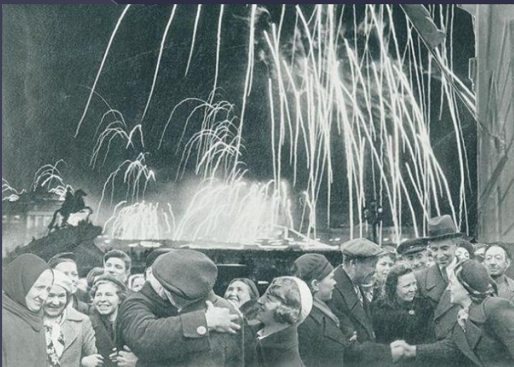
Великая победа одержана Советскими войсками под Ленинградом