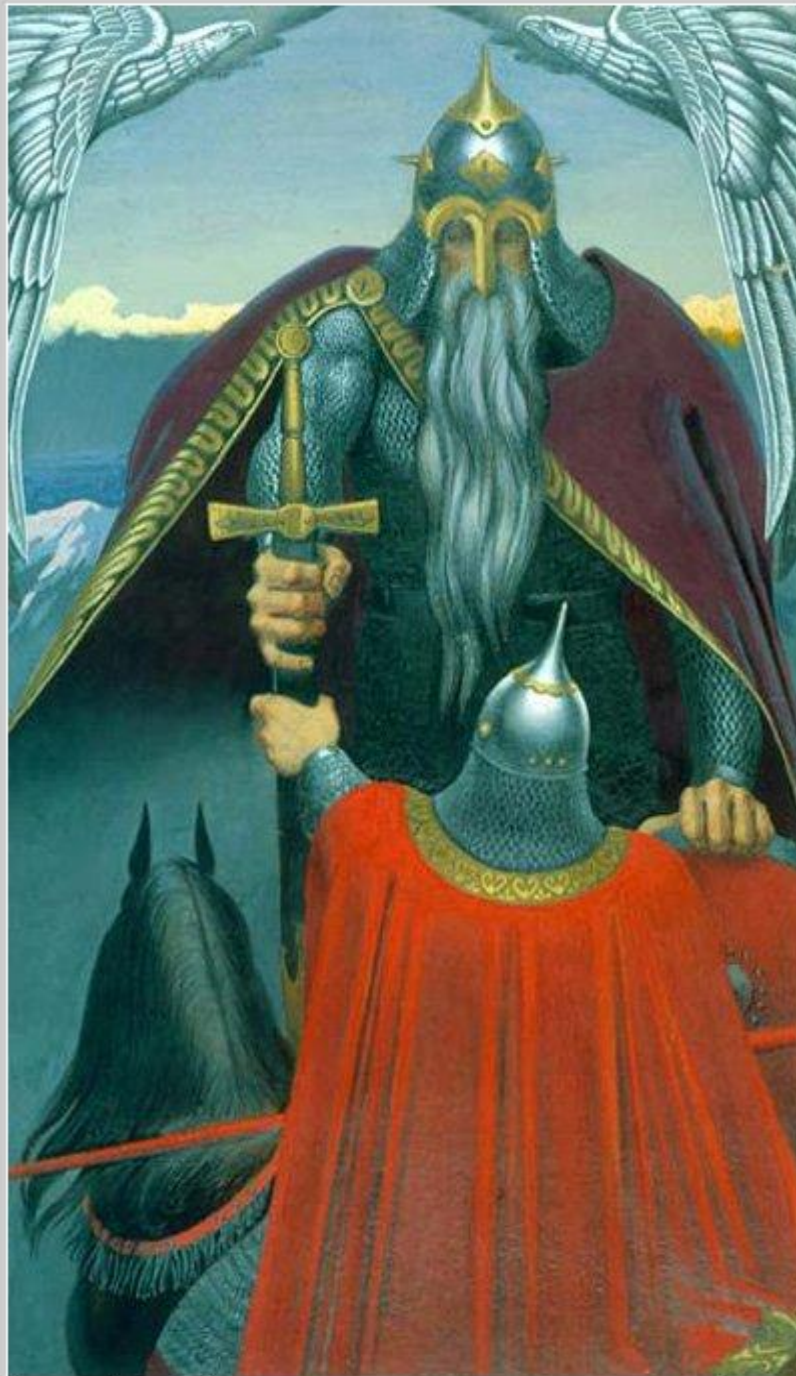
Художник: Васильев К.