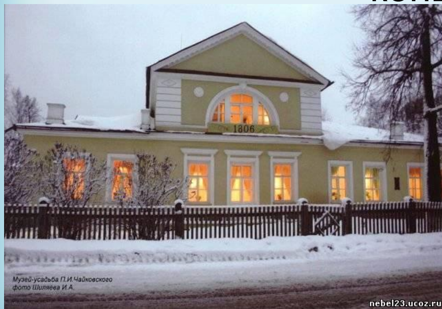
Музей-усадьба П.И.Чайковского

Родился Пётр Ильич в 1840 г. в городе Воткинске, на Урале. Семья была большая. Он был младшим в семье. Родители П. И. Чайковского были музыкантами и дома часто проходили концерты.