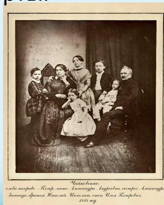
Чайковские: слева направо - Петр, мать Александра Андреевна, сестры Александра, Зинаида, брат Николай, Анна, отец Иван Петрович. 1848 год